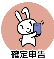
確定申告 (2024年度より)