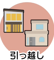
引っ越し (2023年7月頃より)