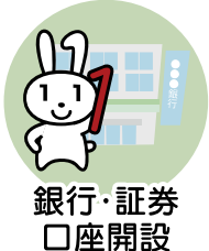
銀行・証券 口座開設