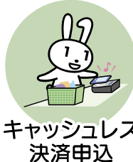
キャッシュレス 決済申込