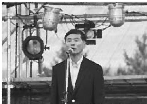
▲男鹿ナマハゲロックフェスティバルにて

今年身体の不自由な方に会場で臨場感を味わっていただきたいとの思いから「ハートフル席」を設けました。駐車場を用意し、トイレもマリナーパーク会場の身体障がい者用を使っていたきました。環境に配慮し、公共交通機関の利用を呼びかけ、臨時列車や臨時バスの運行をお願いしています。