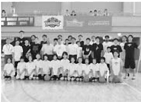
▲練習後の選手らとの記念撮影

8月5日、第26回日本海メロンマラソンが館山近隣公園を主会場に開催され、過去最多の3681名が出場し健脚を競いました。