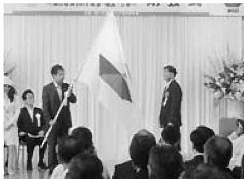
▶フラッグを手渡す平谷尾道市長（左）と渡部市長

式では、次回開催地へのフラッグ引き継ぎが行われ、尾道市の平谷市長から渡部市長に海フェスタフラッグが引き継がれました。