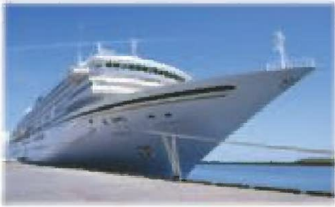
船川港100周年記念事業 写真コンクール