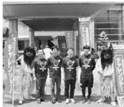
▲チャレンジデー大使と

4月の市長だよりでお伝えしたチャレンジデーのことが5月30日付、日本経済新聞「春秋」のコラムに取り上げられていました。