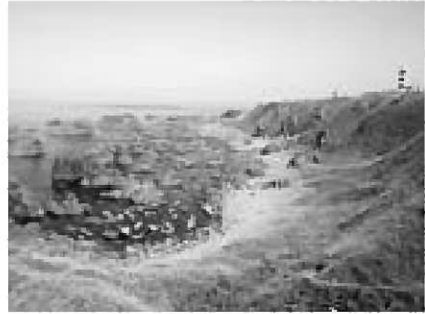
▲ジオサイト：入道崎