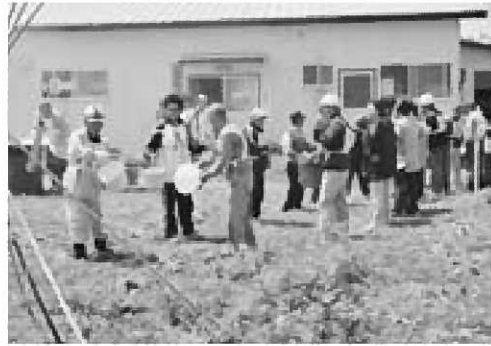
▲荒町地区で行われたバケツリレー

県民防災の日の5月26日、船越地区と船川地区の一部において男鹿市防災訓練が行われました。日本海中部地震から29年となる今年は、津波に対する避難施設として、船川地区ではN.T.Tビルやオガルベ、船越地区では船越小学校、男鹿中学校、男鹿工業高校、清水組への避難訓練が行われました。参加した皆さんは、避難施設の確認により、防災意識を高くしていました。また、船越荒町地区では自主的に防災訓練が行われ、約100名の皆さんが参加しました。