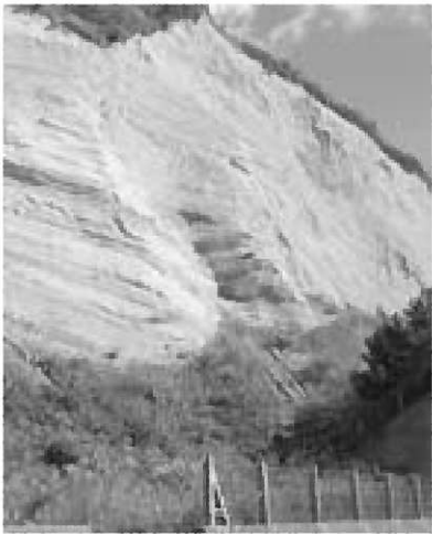
▲ジオサイト：生鼻崎