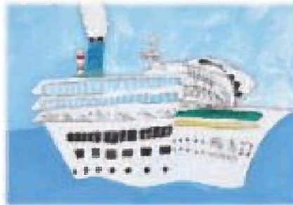
船川港100周年記念事業 夏休み子ども写生大会