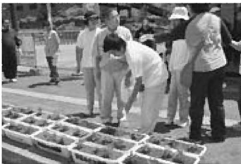
▲みんなで協力して約30個のプランターができました

これは天王みどり学園が、県教育委員会が委嘱する「であい ふれあい まなびあい事業」の交流推進校に指定されたことによるもので、共に育ち共に学ぶ体制づくりを推進するため、今年度は男鹿市とさまざまな交流を行います。