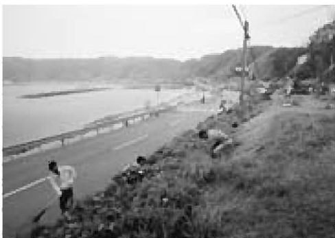
▲ハマナスロードの植栽と清掃活動

同クラブは「男鹿駅伝」のコースとなる戸賀地区ハマナスロードの草刈り清掃や、市内中学生および教職員と共同で行う道路清掃に加え、今後はさらに視野を広げ、環境問題をテーマとした植樹活動にも取り組む予定です。