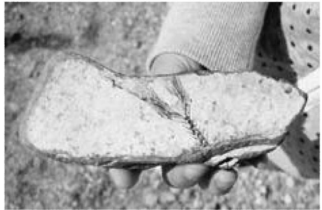
▲鶴ノ崎海岸で見つかった魚の化石

昨年9月の男鹿半島・大潟ジオパーク登録に伴い、男鹿市役所若美庁舎内に『男鹿市ジオパーク学習センター』を開館する予定です。センターでは、男鹿のジオサイトをわかりやすく伝えるため、岩石や化石の展示を予定しています。市民の皆様がお持ちの岩石や化石を広く募集し、展示するスペースを設けたいと考えています。自慢の一品お待ちしております！