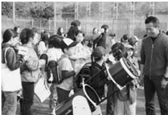
▶登校してすぐに天体望遠鏡をのぞきこむ児童たち