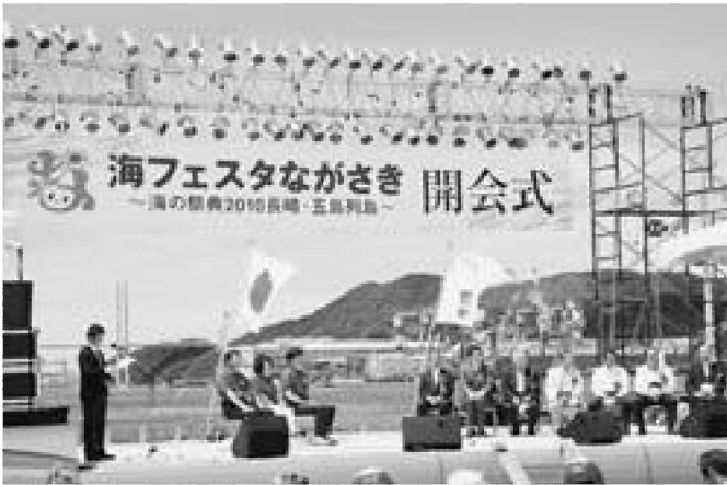
▲平成22年に長崎県長崎市を中心に開催された『海フェスタながさき』の開会式

本市を中心とした5市町村（ほか秋田市、潟上市、三種町、大潟村）は、平成25年『第10回海フェスタ』の開催を国土交通省に要請していましたが、5月9日、吉田国土交通副大臣から渡部市長に決定通知書が交付され、正式に開催が決定しました。今後は、周辺市町村などと組織する実行委員会を立ち上げ、具体的な行事を策定していきます。