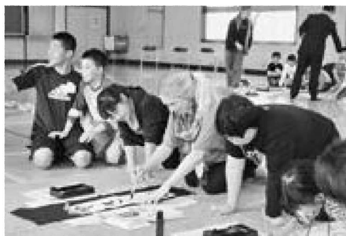
▶手本を見ながら『やさしい』『あいさつ』などの言葉を書き写しました

5月10日、払戸小学校と脇本第一小学校で国際教養大学の留学生との交流会が行われました。払戸小学校で行われた交流会には、5・6年生と留学生4名が参加。留学生が名前と出身地を自己紹介したあと、班に分かれて児童が英語で自己紹介したり留学生へ好きなスポーツなどを質問したりしていました。続いて、留学生たちは児童と一緒に書道を体験。留学生たちは、慣れない書道具の使い方と日本語の文字に苦戦しながらも、丁寧に用紙に収めていました。