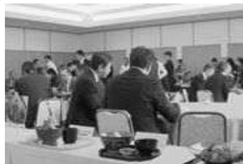
▲ 男鹿ハタハタ丼の発表を兼ねて行われた試食会

男鹿の食生活用観光誘客推進事業が進められていた「男鹿ハタハタ丼」が、4月から市内13店舗で提供されています。 この男鹿ハタハタ丼は、男鹿の二大名物「ハタハタ」と「しよつる」を使った新メニューで、ハタハタと飲食店の持ち味を生かすため、ハタハタを使用すること、味付けにしよつるを使用すること、昼食メニューで丼ものとして提供することの3点が共通ルールとなつていきます。 各店舗で異なった味が楽しめる男鹿の新グルメ、皆さんもぜひ味わってみてください。