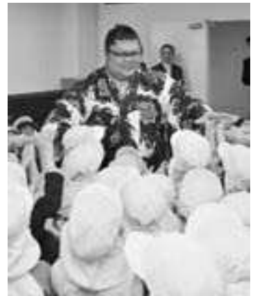
◀ 園児とふれあう豪風関