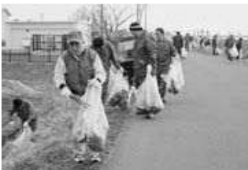
▲ 早朝にもかかわらず昨年を上回る市民の皆さんが参加しました

本格的な行楽シーズンを前に市内を清掃し、市民の環境美化と保全に対する意識の高揚を図るため、4月15日、全市一斉清掃および八郎湖クリーンアップ合同作戦が行われました。 合同作戦には、市民や建設業関係者など約5千人が参加。参加者は、各町内の周辺道路や幹線道路、八郎湖湖畔や沿線道路などに捨てられたごみを拾い集めました。 ごみの運搬は、各事業所や町内会から提供を受けたトラック187台を使用、全市で計34・37㌧のごみが集まりました。