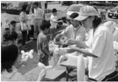
▲多彩なイベントに子どもたちも大はしゃぎ。

参加者には、自分たちで作ったマスコットの見えるいろいろな表情に「めんけえなあ」「孫さいい土産になる」と、大変好評でした。