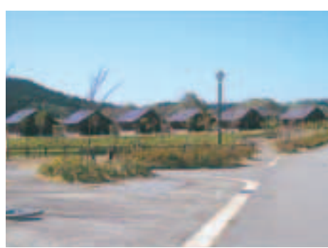
▲手軽にアウトドアを楽しめる、通年営業のコテージ

なまはげオートキャンプ場は、平成12年4月に北浦にオープンして、今年で5年目を迎えます。大自然に囲まれた10畝もの広大な敷地の中に、オートキャンプサイトをはじめ、アウトドアを満喫できる木材をふんだんに使った施設が配置されています。敷地内にあるテントサイトは70区画、キャンピングカーサイトも6区画用意されていて、サンタリー棟(炊事場・シャワー室・トイレ・コインランドリー)は3カ所もあります。センターハウスには事務室やエントランスホール、2階には展望室などもあり、他の施設に比べてもひけをとらない設備となっています。また、オートキャンプライフを楽しむためには、レジャー用品が必要ですが、テントやキャンプ用品が無いと言つ方でも、テントはもろろん食料品から遊具まで数多くの物品をセンターハウスで購入したり、借りたりできます。マウンテンバイクを借りて近くを散歩するのもおもしろいかもしれません。また、キャンプはちよつと苦手という方にも、敷地内に6棟のコテージが用意されていますので、手軽にアウトドアを楽しむことができます。