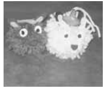
▲一つ一つ違う表情を持ったマスコットができました。

9月12日から16日までの日程で、特別養護老人ホーム和幸苑（角間崎）で、生涯学習奨励員による体験学習交流会が行われました。体験学習交流会は、市内外で活躍している生涯学習奨励員の皆さんが、日ごろの活動での学習成果を、交流会を通じて「いつでも、どこでも楽しく学べる体験の場」として提供しようとして、昨年度から行われています。