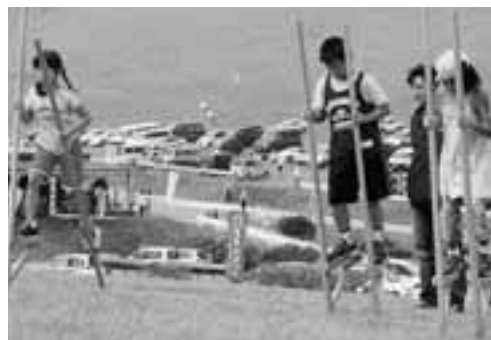
▲なかなか前に進まない竹馬競争。

毎年秋の恒例行事の「寒風山まつり」が、9月18と19日の2日間にわたって開催されました。初日はあいにくの強風で中止になったパラグライダー体験飛行も、2日目は抽選になるなど、たくさんの皆さんが訪れ、若美ベンチャーズの演奏や仮装踊り、標高3555メートルの花火など、多彩なイベントが行われました。また、子どもに大人気のアニメのキャラクターショーや宝探しゲームも行われ、集まったちびっこからは歓声が上がっていました。