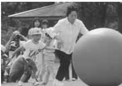
▲元気いっぱいの園児たちに、保護者や祖父母から大きな声援が送られていました。