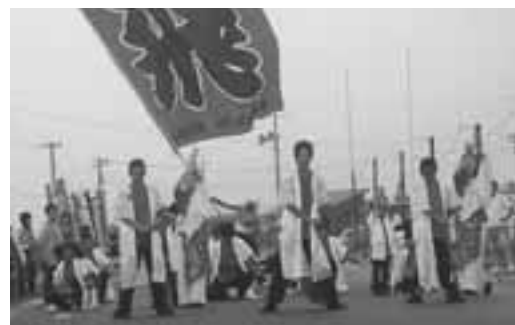
▲男鹿市内からは、2チームの参加があったヤートセ踊り。(写真は、飛楽朮来のみなさん)

午後から、一時激しい雨に見舞われましたがヤートセ踊りが始まる頃には、みんなの願いが天に通じて雨も上がり、両手に鳴子を持った踊り手に混じって踊る見物客も見られ、会場はこの日一番の盛り上がりを見せていました。