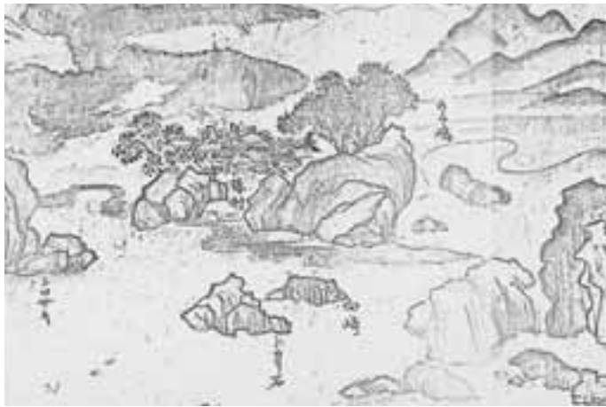
江戸時代に描かれた椿