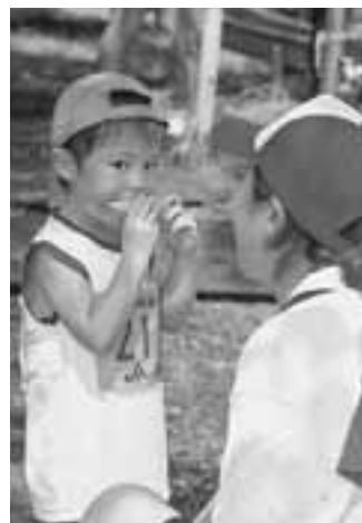
▲「ガブッ。このメロンおいしいなあ！来年もまた走ろうね！」

8月7日、第19回日本海メロンマラソンが館山近隣公園を主会場に行われました。昭和62年に、旧若美町で「真夏のマラソン」「メロンが食べられるマラソン」としてスタートし、今年で19回目を迎えた大会には、市内をはじめ北海道から九州佐賀県まで、全国各地から1756人のランナーが参加しました。