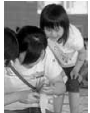
▲「ねえ、何ができるの？」 「ん～？できてからの楽しみ!!」

7月28日から4日間、船川北公民館と市総合体育館を主会場に、東京芸術大学剣道部とのふれあい交流が行われました。