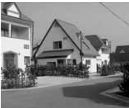
▲調査の結果は都市計画などに活かされます。（写真は市営住宅諸産堤団地）

国勢調査の結果は、都道府県議会や市町村議会の議員数の決定、地方交付税交付金の算定基準などに用いられたり、都市計画や社会福祉政策、経済政策、防災計画などを立てたりするときの基礎資料として活用されます。このほかにも、将来の人口予測や人口分析など、様々な分野で調査結果が使われます。