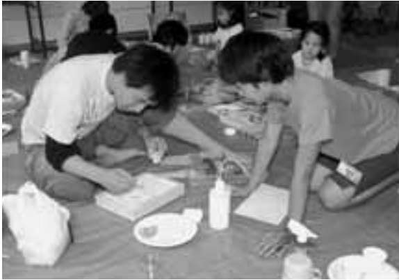
▶学生は、教えるだけでなく、子どもたちから教わることも多いそうです。