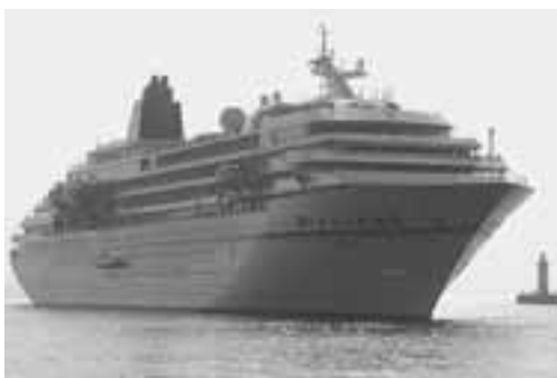
▲ひときわ大きなその姿は、生鼻崎トンネル付近からでも一目でわかるほどです。

現在の「飛鳥」が船川港に寄港するのは今年が最後です。来年からは、現在の船より長さで約50 + 、部屋数で100部屋多い「飛鳥II」が船川港に寄港する予定です。皆さん楽しみにお待ちください。