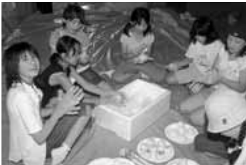
▲ふだんからお手伝いをしているのか、児童達は慣れた手つきでおにぎりをつくっていました。

児童たちはこの研修を通じて、ふるさとの自然に触れ、学区を越えての友情を得ることができました。