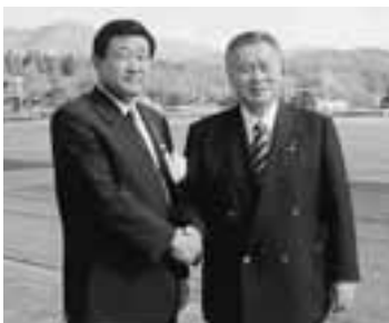
ラグビーフットボール競技の開始式には、第62回国民体育大会会長で(財)日本ラグビーフットボール協会会長の森喜朗元総理が出席されました。