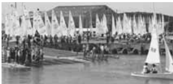
応援団から声援を受け競技海面へ出艇。