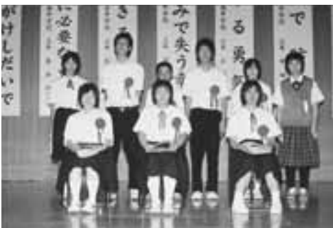
▲この大会は、中学生の防火・救急救命への意識の高揚と啓発を目的に行われています。

9月10日に男鹿地区中学校防火・救急救命弁論大会が、潟上市の天王南中学校で行われました。今年で35回目の大会には、男鹿市、潟上市、大潟村から9名が出場し、防火・救急救命に関して日常で感じたことや体験したことを題材に熱弁を振りました。