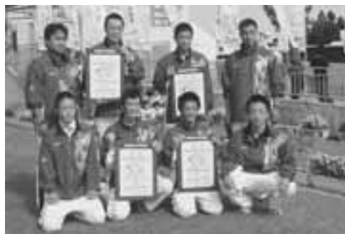
各階級で活躍した秋田県チーム。