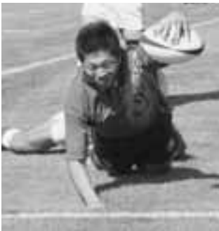
勝利を決定付けるトライ!