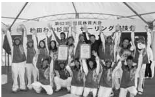
総合成績第3位の秋田県チーム。