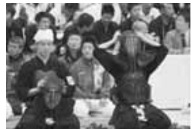
決勝の大一番。集中力が高まります。