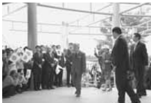
ボクシング競技をご覧になられた常陸宮同妃両殿下。