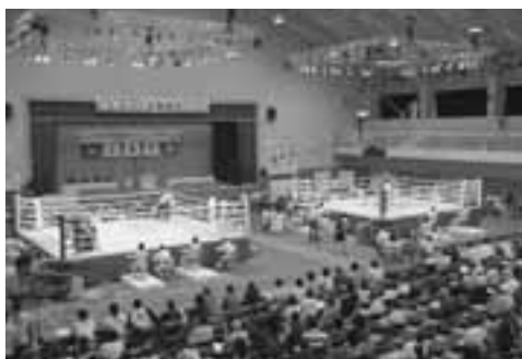
照明を備えた特設リング2基の上で熱戦を展開。