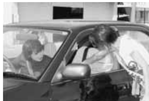
▲「安全運転をお願いします」と声をかけ、ドライバーに交通安全を呼びかけました。

秋の全国交通安全運動の一環として、また、国体でたくさんの方々が本市を訪れ、交通量が増えることから行われたこの活動。「交通事故に注意し（中石）、交通事故・飲酒運転は絶対になし（梨）！」と、五里合中石産の梨と啓発用のチラシをドライバーに手渡し、交通事故防止と飲酒運転防止を呼びかけました。