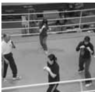
▲ボクシングエクササイズ

10月6日の準々決勝終了後、行われたイベント事業では、女性と小学生を対象にした「ボクシングエクササイズ」と、市内の小・中学生が参加しての「ボクシング体験」が行われました。 ボクシング体験では、なまはげがセコンドとして子どもたちを勇気付けてくれました。参加した子供たちが選手を圧倒する場面もあり、会場は大いに盛り上がりました。