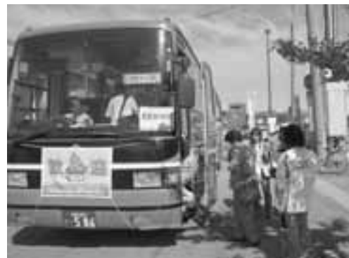
▲競技会場へは、シャトルバスが運行されました。