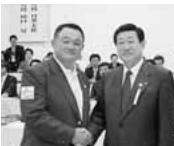
剣道競技の開始式には、ロサンゼルスオリンピック柔道の金メダリスト、山下泰裕さんが神奈川県選手団団長として出席されました。