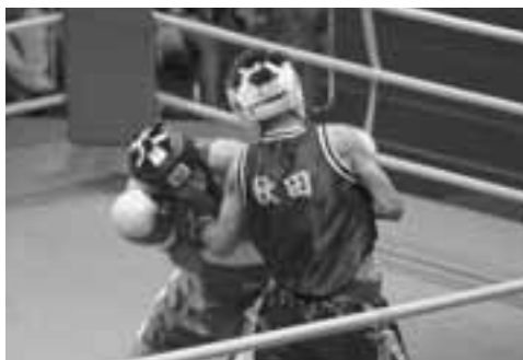
強烈なボディが入った瞬間。