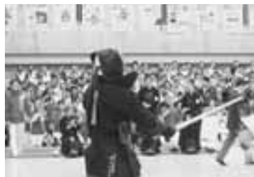
大将戦で優勝が決まり、喜びに沸く会場。(少年男子)