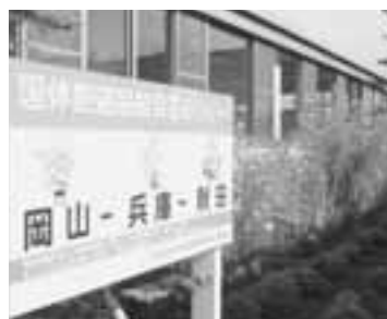
▲この種は来年の剣道競技開催地、大分県豊後大野市へと引き継がれます。

会場を彩った交流の花 剣道競技会場に飾られた大きな椿の絵。これまで毎年行われてきた東京芸大の学生たちとのふれあい交流によって生まれたものです。来場し観戦された市民の皆さんの中にも、懐かしい日々を思い出し方がいたことでしょう。