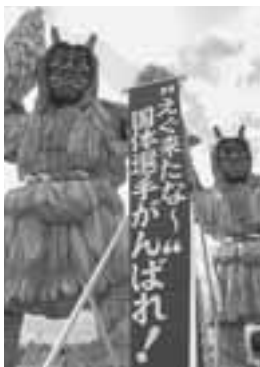
▲男鹿総合観光案内所に設置された歓迎看板。