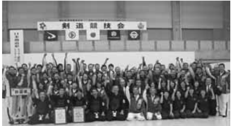
完全制覇の偉業を成し遂げた秋田県選手団。歓喜のガッツポーズ。