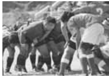
全身に力を込めてスクラムを組みます。