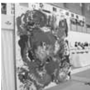
▲約3m四方の大きく、色鮮やかな絵は、見る者を圧倒します。

剣道競技には、成年男女・少年男女の4種別に、各ブロック予選を勝ち抜いてきた都道府県(成年男子のみ47都道府県)の選手、総勢587名が出場し、トーナメント方式で優勝を争いました。 インターハイ優勝校や警視庁などの強豪が顔をそろえる中、秋田県は、4種目すべてで優勝(いずれも初優勝)を収め、2年前の岡山国体で岡山県チームが達成して以来の、完全優勝という偉業を成し遂げました。 秋田県チームの快進撃に、連日会場は大いに盛り上がり、選手が技を決めるたびに、会場の静寂が一転し、割れんばかりの声援に包まれていました。