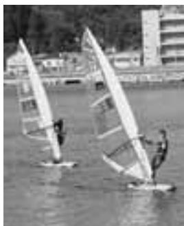
種目の中で一番スピードの でウインドサーフィン。