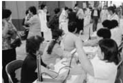
▲行列のできるコーナーもあり、多くの人でにぎわいました。

健康に関心を持ち、健康な身体づくりに役立ててもらおうと、10月13日、男鹿みなと市民病院で「ふれあい祭」が開催されました。血圧や身体年齢などの測定、生活習慣病の食事に関する相談など各種相談コーナーにはたくさんの方が訪れ、医師や看護師からのアドバイスに耳を傾けていました。また、お茶席やバザー、北陽小学校民謡クラブによる民謡の発表、職員有志などによる椿太鼓の演奏なども行われ、入院患者さんをはじめ、訪れた人たちは楽しい時間を過ごしていました。