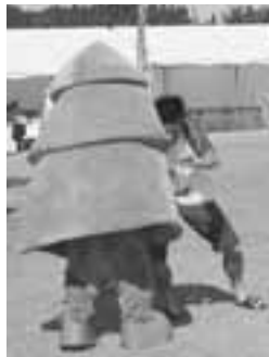
スギッチVS福岡県選手。