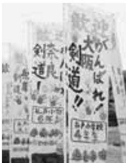
▲競技場に設置された、小学生手作りの応援・歓迎のぼり旗。