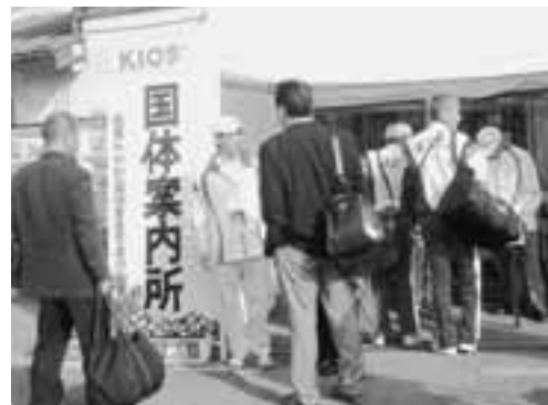
▲JR男鹿駅と船越駅には、国体案内所を設置しました。