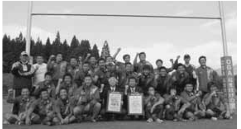
圧倒的な強さを見せ付けたラグビー成年チーム。