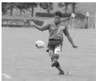
▲正確無比なゴールキック。

ラグビーフットボール競技には、各ブロック予選を勝ち抜いた12チーム・264名の選手が出場し、前・後半30分ハーフ(決勝は35分ハーフ)のトーナメント方式により優勝を争いました。 秋田ノーザンブレッツの選手を主体に構成された秋田県チーム。ラグビー王国秋田を象徴するかのように、決勝までの4試合、1度もリードを許すことなく勝ち進み、見事初優勝の栄冠に輝きました。 優勝の前評判が高かったラグビー成年男子。試合を一目見ようと、連日、駐車場が満車になるほどたくさんの方が会場に駆けつけ、選手たちに熱い声援を送っていました。