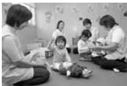
▲子どもたちは、広いスペースで思いっきり遊んでいました。

セーリング競技は、成年・少年各男女の部の10種目に47都道府県から519名が出場して行われました。競技は、生鼻崎沖をA海面、OGAマリンパーク沖をB海面として行われました。 OGAマリンパーク展望台では、日本セーリング連盟の方が、競技観戦に訪れた中学生に、競技のルール・見どころなどを詳しく説明してくれました。また、展望広場からはB海面のゴールが間近に見られるため、多くの方が観戦に訪れていました。 競技開催期間中は連日、市内外から多くの方が観戦に訪れ、風を受けて、艇を自在に操る選手たちに声援を送っていました。