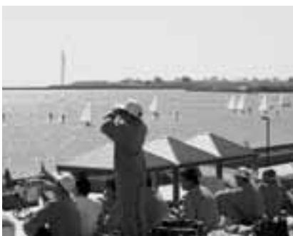
OGAマリンパークから。