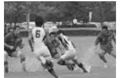
雨中決戦。水しぶきが激しさを物語っています。