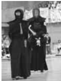
間合いをはかり、攻撃のチャンスをつかがう両選手。