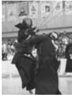
「面！」一瞬のスキを狙います。