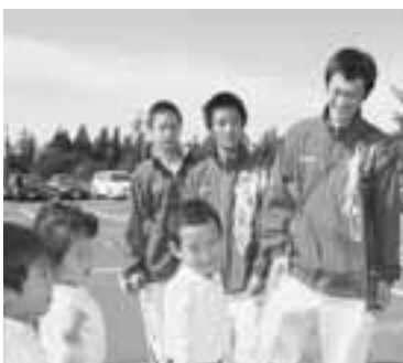
若美幼稚園児とふれあう選手たち。