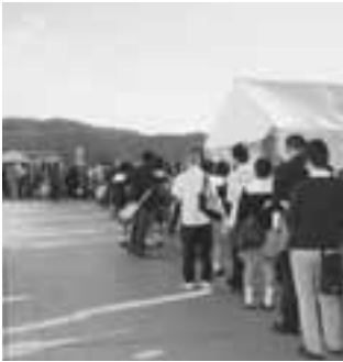
開場前からすでに行列ができていました。