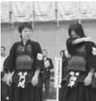
初優勝に涙が止まらない少年女子チーム。