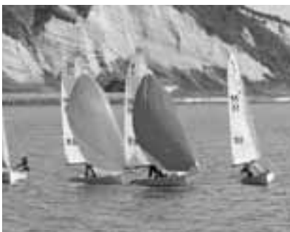
生鼻崎トンネル付近。