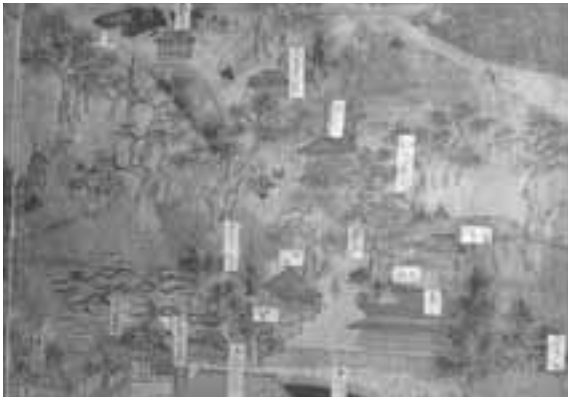
「男鹿図屏風」に描かれているたくさんの建物

また祓川という所もありますが、これは神社に入る時に身の汚れをはらうため、ここでみそぎをしたことから付けられたものだといわれています。そしてこの川を渡る橋を極楽橋と呼んでいました。また、ここから鬼が築いたとされる999の石段が続いており、その周辺には堂の跡や池などが見られます。