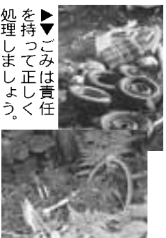
▶▶ごみは責任を持って正しく処理しましょう。

市では、市長より委嘱を受けた「男鹿市廃棄物不法投棄監視員」が、定期的に市内の巡回パトロールを行い、不法投棄の防止に努めています。 廃棄物を不法に投棄する人は、撤去するように指導を行います。