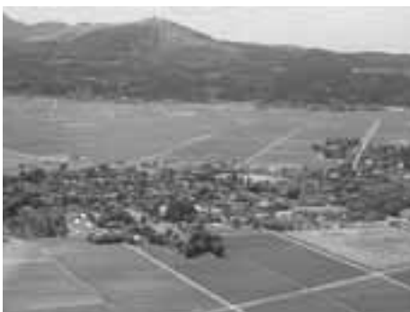
▶かけがえのない自然を守っていきましょ。

今一度私たち一人ひとりが『ごみのポイ捨て』『不法投棄』は絶対にしない、させないという強い意志と厳しい目を持つて、自分たちの住むまちはきれいにするとう意識で美しい自然と住みよい環境づくりに努めましょう。