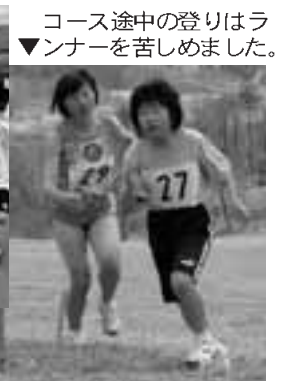
▼コース途中の登りはランナーを苦しめました。