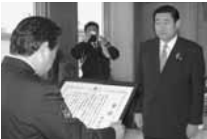
▲今後も、市民が丸丸となって交通安全に努めましょう。

今後も、交通事故のない明るく住みよい男鹿市をつくるため、急がずにマナーとゆとりで、交通安全に努めましょう。