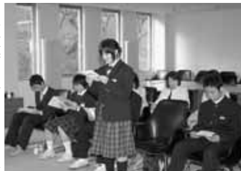
▶海外研修では、たくさんのお出会いと感動がありました。

生徒達はこの海外研修で、日本と異なる文化に触れ言葉の壁を乗り越えての交流を経験し、挑戦する気持ちと、広い視野、人と人とのコミュニケーションの大切さを学びました。また、自分たちのふるさと『男鹿』の素晴らしさを、改めて実感しました。