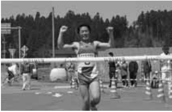
▶一般の部で、本内・福野・申川チーム、堂々の一位でゴール!!