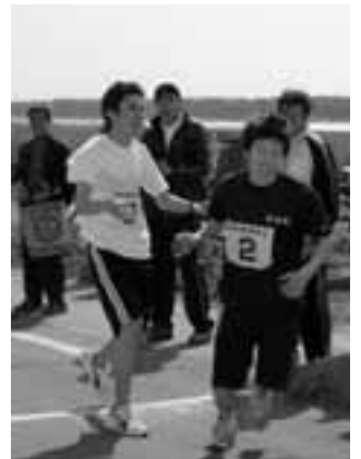
▲あ〜疲れた〜。あとは頼む!!

4月29日、若美地区をたすきでつなぐ伝統のある第47回若美親善駅伝大会が行われました。毎年、若美地区の祭典の日にあわせ、地域の活性化と健康で明るく心豊かなふれあいの輪が地域全体に広がることを目的に行われているもので、地区北端の五明光町内をスタートし、南端の小深見町内を折り返して、若美総合支所でゴールとなる特設コースで行われました。