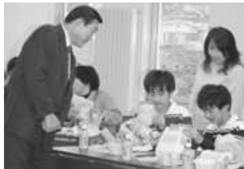
▲陶磁器センターで初めて作った陶器は、児童たちの大切な思い出の品となりました。

男鹿・春日井市児童交流学習が10月20日～23日の日程で行われ、本市の児童26人が春日井市を訪れました。その報告会が12月20日に行われ、参加した児童一人ひとりが交流会の感想を発表しました。「4日間はあっという間だった」「新しい友達をたくさん作ることができた」「男鹿にいる時は気づかなかつたが、違う土地に行って初めて気づいた男鹿の良さがあった」など、ホームステイや春日井市の小学生との交流など、内容の濃い4日間は、児童たちにとって貴重な体験となったようでした。