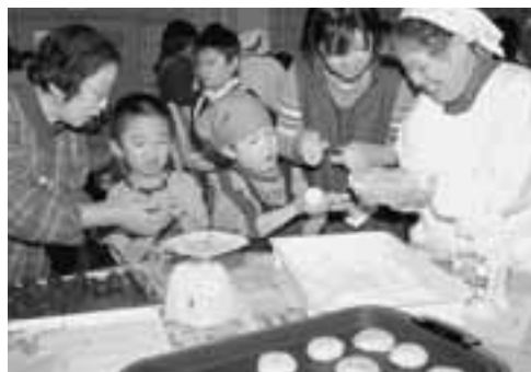
▲子どもたちは、どうやら粘土遊びの要領で…とても上手に作ります。

12月17日、若美コミュニティセンターで「親子でおやき名人大作戦・アツアツおやき作り」が行われました。これは、県の男女共同参画パワーアップ事業の一環で、若美地区の親子約40人が参加しました。 最初に実行委員が、食事の支度を題材に男女共同参画を考えていく、対話劇「俺のめしは？」を上演、その後、おやき作りとなりました。 名人の秘伝レシピに従い、硬くならない皮と絶妙な量のおあん、きつね色に焼けた表面は、サクッと香ばしく、格別のおいしさだったようです。