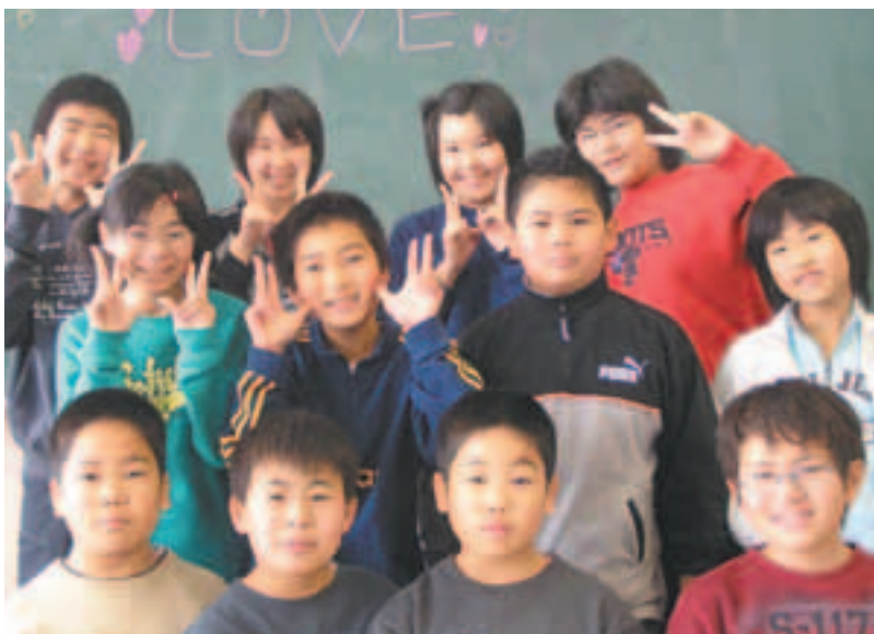
平成7年生まれ 脇本第二小学校 5年生の皆さん

明けましておめでとうございます。今年は健康に気をつけ、昨年以上に趣味の活動に力を入れたいと思っています。6月に男鹿カラオケサークル10周年記念リサイタルに出演するので、万全の状態です。舞台に立つことと、バレーボールチーム「椿エンジェルス」での全試合に出場することを目標にしています。泣いても笑っても一度きりの人生、楽しく過ごしたいです。