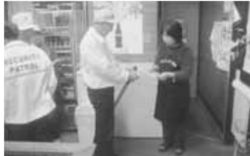
▲若美地区の、駐在所・防犯協会若美支部・防犯指導隊・交通安全協会若美支部・交通指導隊が、合同でパトロールを行いました。

12月15日、安全で安心な地域づくりの取り組みとして、若美地区の防犯・交通安全に関わる活動をしている各団体が合同で、防犯・飲酒運転防止パトロールを行いました。 昼間は金融機関や郵便局などを中心にまわり、強盗や振り込め詐欺などへの注意を、夜間は、飲食店などをまわり飲酒運転防止を呼びかけました。また、パトロール先では、子どもたちが巻き込まれる事件や犯罪を未然に防ぐために、見守り活動を積極的にを行うことを呼びかけました。