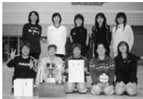
▲見事なチームワークと力強いプレーで2連覇を達成した五里合ボンバースの皆さん。