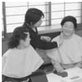
▲会場では、参加した皆さんの素敵な笑顔がたくさん見られました。

11月29日「アンチエイジング（抗老化）女性の健康について」と題して、保健推進員の研修会が行われました。抗老化に効果があるといわれている「化粧」。この日は、男鹿中地区の保健推進員が肌の手入れ方法やメイクアップ技術を通じて、更年期以降の女性の健康について学びました。