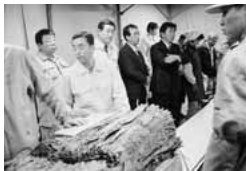
▲コンベヤーで運ばれてくる葉タバコは鑑定員により葉の部位や等級が評価されます。