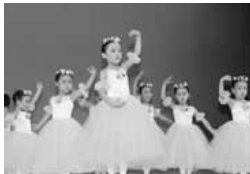
▲小さなバレリーナの登場に、客席からは「めんげえなあ」との声。

また、5日に大ホールで行われた舞台発表では、開場と同時にたくさんの方が来場しました。出演者がステージ上で、大正琴やオカリナの演奏、歌や踊りなど日ごろ練習している成果を披露すると、会場からは大きな拍手や歓声が上がっていました。