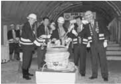
▲樽みこしにより運ばれた酒樽で鏡開きを行い貫通を祝いました。