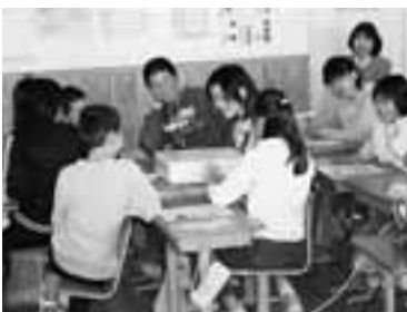
▲現金1億円の模造品を手にした児童たちからは、驚きの歓声が上がっていました。

10月19日「税を考える週間」を前に、鵜木小学校で租税教室が行われました。 児童たちは、税金のしくみや納税する意味など、暮らしに深く結びついている「税」について学びました。 10月26日には、秋田南税務署を訪れ、署内の見学をしました。