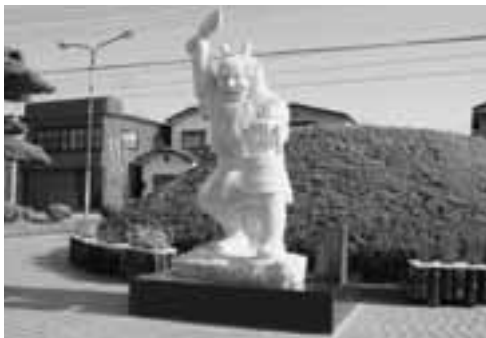
▲皆さんも市役所を訪れた際には、石で作られたなまはげをご覧ください。

男鹿市に、なまはげの石像が寄贈されました。これは、株式会社吉政石材から贈られたもので、市役所玄関前に設置されました。