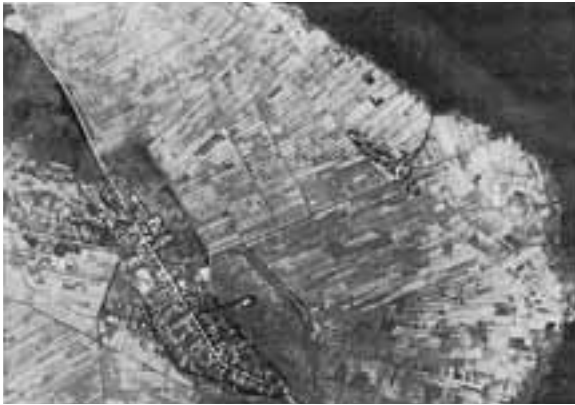
▲左側の集落が渡部。右側の集落が潟端（昭和30年代）

集落内の世帯数は、昭和30年代には43世帯ほどでしたが、現在は50世帯となっています。