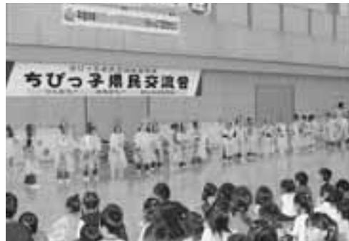
▲市内の保育園と幼稚園の園児は、「なまはげ踊り」を披露しました。

10月14日、男鹿市総合体育館でちびっ子県民交流会が開催されました。この交流会は、県教育委員会のちびっ子県民交流推進事業で、男鹿市をはじめ近隣の市町村から、保育園や幼稚園などの園児とその保護者が一堂に会して行われました。 はじめに、来年の国体を盛り上げるために作られた体操「ガリッとガンバ」で体をほぐしたあと、ステージ発表が行われました。全体交流では、親子がふれあいながらできる体操のほか、違う園のお友達と一緒にゲームを楽しみ交流を深めました。