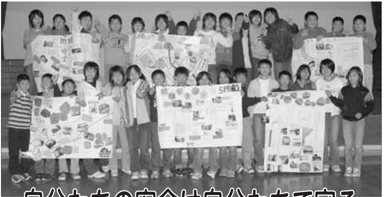
▶学校周辺の安全個所と危険個所をまとめ地域安全マップを作成した、船川第一小学校5年生の皆さん。