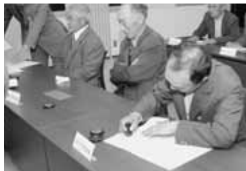
▲地区の町内会や保護者の代表が出席して調印式が行われました。