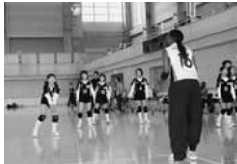
▲教室に参加した中学生からは、チームの欠点を教えてもらい、とても勉強になったとの声が聞かれました。

10月21日、男鹿市総合体育館を会場に、バレーボールケニア女子ナショナルチームと、県選抜女子チームとの国際親善試合が行われました。 試合に先駆けて、市内の小中学生が参加してバレーボール教室が行われました。教室では、トスやレシーブなどの基本的な練習が行われ、参加者はケニアの選手たちのアドバンスに一生懸命耳を傾けていました。 続いて行われた親善試合では、レベルの高い戦いが繰り広げられ、ポイントが決まるたび、会場にはどよめきや歓声が響きわたっていました。