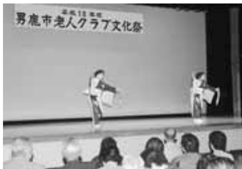
▲会場に入れきれないほどの来場者があり芸能発表は盛り上がっていました。

10月19日、男鹿市老人クラブ連合会主催の文化祭が開催されました。はじめに式典が行われ、長年にわたり老人クラブ活動の推進と育成に尽力された個人や団体に、表彰状や感謝状、記念品が贈られました。