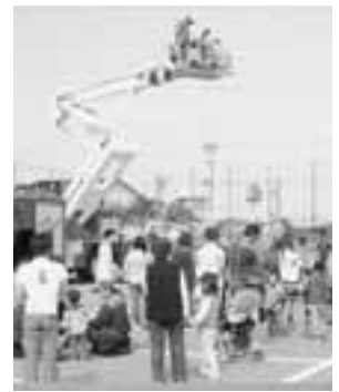
▲地上8メートルの高さまで上昇した子どもたちは、下で待つ家族に笑顔で手を振っていました。

10月15日、男鹿地区消防署主催の「消防ふれあい広場」が行われました。このふれあい広場は、市民から消防業務への理解を深め、同時に防火意識を高めてもらおうと、毎年、秋の火災予防運動前に行われていて今年で12回目になります。