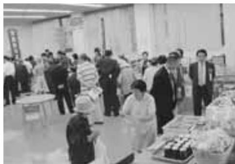
▲オープン当日、1階の市民開放ロビーは、多くの市民が訪れ、にぎわいました。

会館の名称のオガルベは、公募による「おがる(成長する)」と「男鹿」から付けられました。館内には、市商工会の事務所のほか、1階の市民開放ロビーには、男鹿海洋高校の生徒が製造した魚の缶詰などを販売する実習店舗やミニ水族館、近くの食堂からの出前ができるテリバリコーナーなどがあります。皆さんお気軽にお立ち寄りください。