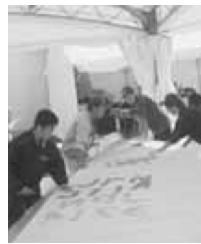
▲真剣なまなざしで計測に励む男鹿海洋高校の生徒たち。

秋田わか杉国体のリハーサル大会として、9月15日～18日の4日間、船川港特設セーリング競技場で、全日本セーリング選手権大会、全日本実業団ヨット選手権大会、全日本セーリングスピリッツ級選手権大会が行われました。