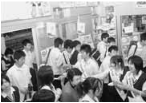
▲男鹿駅では、男鹿海洋高校の生徒の皆さんも広報活動を行いました。