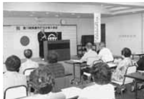
▲尺八の演奏を交えながらの講話は大好評でした。

この日入学した34名は、これから年に4回行われる、さまざまな学習会を楽しみに行っているようでした。