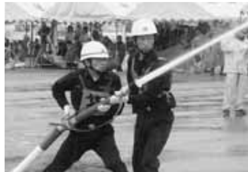
▲真剣なまなざしで、本番さながらの小型ポンプ操法を行いました。

7月2日、雨が降る悪天候の中、マックスバリュ男鹿店の駐車場を会場に、男鹿市消防団消防操法大会が行われました。大会には、市内14分団から出場があり、日ごろの訓練の成果を競い合いました。 【大会の結果】 第1位/第7分団（琴川） 第2位/第6分団（船越） 第3位/第12分団（渡部） ※第7分団は、7月23日に開催の県消防協会男鹿潟上南秋支部消防操法大会に市の代表として出場します。