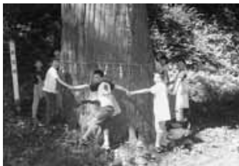
▲樹齢約400年の「鵜木の親杉」。根元の太さは7メートル、児童7人が手をつないで太さを実感しました。

6月29日、野石小学校の3年生が参加して「ふるさとめぐりバスツアー」が行われました。学校を出発した児童たちは「鵜木の親杉」「渡部家正門」「渡部村村法碑」「若美漁港」などをまわり、自分たちが暮らす若美地区の歴史と文化、施設の設備やそこで働く人の努力を学びました。 若美公民館の職員からの説明を熱心に聞き、疑問に思うことなどを質問する児童の姿が見られ、このバスツアーを通じて地域の新しい発見がたくさんありました。