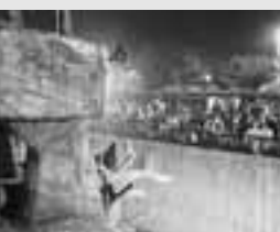
▲日中とはまた違った動物たちの姿が見られます。