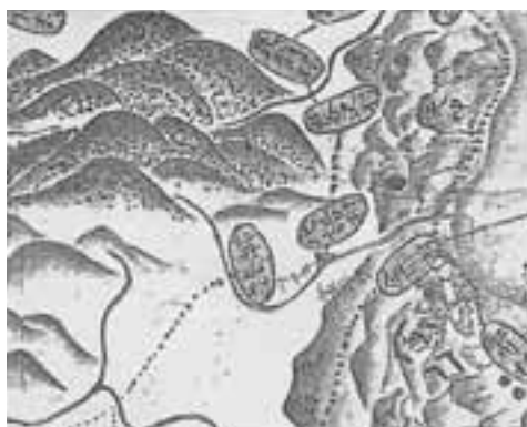
江戸時代の地図に記された仁井山