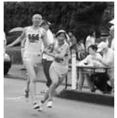
▲県勢1位の花輪高校。前を走る選手を追いかけます。

7月1日、男鹿半島を舞台に「男鹿駅伝競走大会」が開催されました。当日は、あいにくの雨模様でしたが、一般、大学、高校男子、高校女子（オープン参加の大学女子を含む）の4部門に114チームが出場し、健脚を競い合いました。