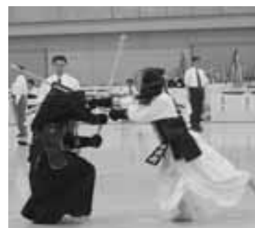
▲一瞬で決まる剣道競技。参加した選手たちは日ごろの練習の成果を発揮しました。

平成18年秋田わか杉国体に向けてのリハーサルとして、6月15日～18日の4日間、総合運動公園陸上競技場とOGAマリンパーク球技場でラグビーの東北高校選手権大会が、24日～25日の2日間、市総合体育館で剣道の東北高校選手権大会がそれぞれ行われました。