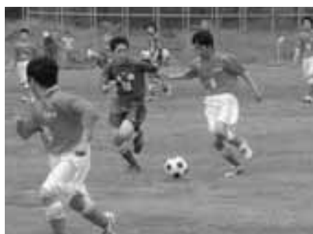
▲ゴールを目指して力走する選手たちには、大きな声援が送られていました。

大会には、男鹿東、男鹿南、男鹿北中学校をはじめ、全県から15校が出場し、「長良杯」の獲得を目指して、熱い戦いが繰り広げられました。