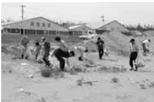
▲拾い集められたごみの中には、外国から流れてきたものも多くありました。

今年、環境省が定める「快水浴場百選」に選出された宮沢海水浴場は、水質や自然環境の美しさに加えて、地域住民や地元の小中学校の清掃活動も評価を受けています。美しい環境を保つためご協力をお願いします。