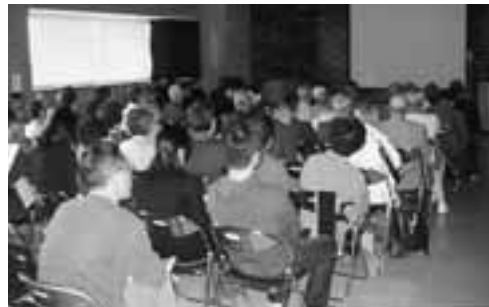
▲会場には市内からの参加者が多く見られ、地元の遺跡の調査報告に興味深く聞き入っていました。

平成19年度埋蔵文化財発掘調査地域報告会が、5月19日に脇本公民館で行われました。これは、秋田県埋蔵文化財センターと男鹿市教育委員会が、平成18年度に行った遺跡の調査内容を発表するもので、市内外から約90名の参加がありました。 この日紹介されたのは、国指定史跡の脇本城跡のほか、小谷地遺跡、脇本遺跡などの9遺跡で、参加者たちは当時の生活様式、出土した土器や石器、陶磁器などの説明に熱心に耳を傾けていました。