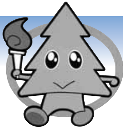
秋田わか杉国体 マスコットマーク スギッチ