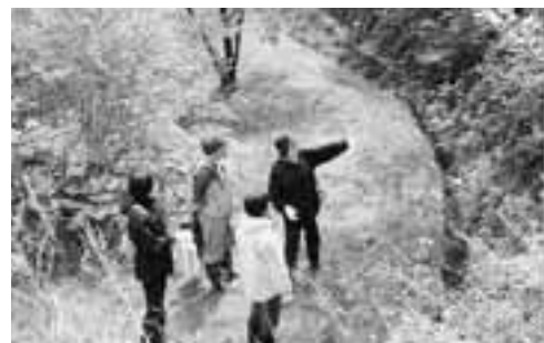
▲講師の方からは「自信がないものは採らない、根こそぎ採るのは避ける」など、山菜採りのマナーや注意点が話されました。

5月13日、男鹿を美味しく元気にする会主催の「山菜採りマナー講習会」が十二桜森林公園で行われました。講習会には、市内外から約30人が参加し、実際に山に入って山菜採りに挑戦しました。講師は山が好きな地元農家のお母さんたち。参加者は、講師の方からアドバイスを受け、ワラビやウド、セリやタラノメなどを袋いっぱい集めていました。終了後は、採れたての山菜を使ったてんぷらバイキングが行われ、参加者は、山の恵みを肌で感じながら、てんぷらに舌鼓を打っていました。