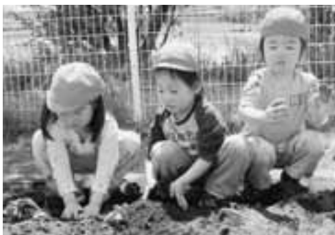
▲園児たちは、手を真っ黒にして頑張りました。

5月22日、五里合保育園の園児が、サツマイモの苗植えに挑戦しました。この日植えられた苗は50本。年長さんがお手本となつて、1本1本丁寧に苗を植えていました。 「大きなーれ、大きなーれ」と園児たちの願いが込められたサツマイモ。園児たちは、秋の収穫に向け「水やりや草取りを頑張る」と意気込んでいました。 収穫したサツマイモは、五里合海水浴場で木を集め、焼き芋にして食べるということです。