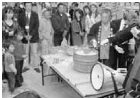
▲熱した石が桶に入ると湯気が上がると、来場者から大きな歓声が上がっていました。

5月15日から市内で開催する、食の祭典「鯛まつり」を前に、5月13日にジョイフルシティ男鹿店でオーピングイベントが行われました。イベントは、なまはげ太鼓で幕を開けたあと、男鹿沖で獲れた真鯛の刺身や、石焼き料理の実演・試食に長い列ができました。この日はどちらも200食用意され、親子連れや買い物客でにぎわいました。鯛まつりは、市内の旅館・ホテルなどで今月30日まで行われています。この機会に、旬の幸を味わってみてはいかがでしょうか。