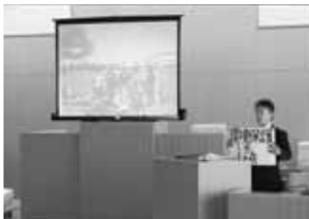
▲メッセージカードを使ってクイズ形式にするなど、工夫をこらした発表が行われました。

日本では決して得られない今回の体験は、生徒たちにとって生涯忘れえぬ思い出となったことでしょう。このかけがえないオーストラリアでの時間を忘れることなく、これからの人生に生かしてほしいと思います。