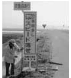
▲男鹿地区交通安全協会若美支部では、交通安全啓発看板を設置し、交通安全を呼びかけました。

5月11日から20日までの10日間、春の全国交通安全運動が行われました。期間中、市内では「子どもと高齢者の事故防止」を運動の基本として「飲酒運転の根絶」「自転車の安全利用促進」「後部座席を含むシートベルトとチャイルドシートの正しい着用の徹底」の3つの重点目標のもと、さまざまな運動が展開されました。