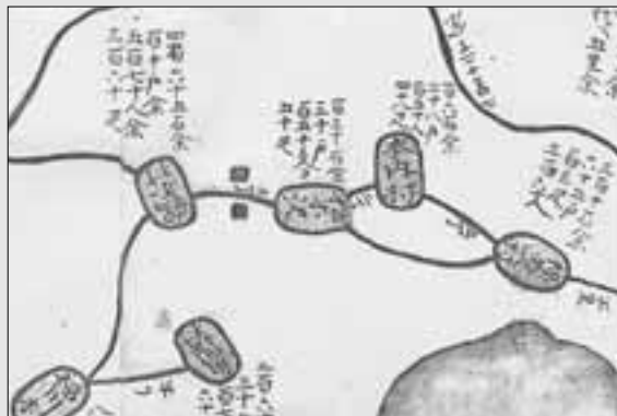
▲江戸時代に描かれた本内周辺

真澄は、ここを訪ねる前には蝦夷島(北海道)を探訪して来ており、蝦夷の知識が十分あったので、なんの疑問ももたず蝦夷語が由来であると記しています。