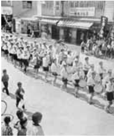
▲昭和36年国体での市中パレードのようす。

6月21日(木)で、国体の開幕まであと100日となります。そこで、これからみんなが気持ちを一つにして盛り上がり、よい雰囲気で開催の日を迎えられるよう願って「国体100日前パレード」を開催します。 当日は、吹奏楽や太鼓の演奏、元気いっぱい体操や踊りなどといった楽しいセレモニーのあと、740人を超えるパレードの列が市役所前から出発し、元浜町、栄町を通って市役所前に戻る、約18kmのコースを練り歩きます。 皆さん、ぜひ楽しいパレードを見に来てください。そして、一緒に秋田わか杉国体を盛り上げましょう!