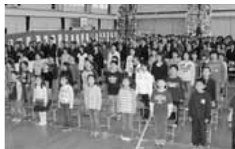
▲式の最後には、出席者全員で、脇本第二小学校の校歌を斉唱し、慣れ親しんだ脇二小に別れを告げました。

全校児童46人による「お別れの言葉」では、楽しかった思い出を振り返り、学校への感謝の気持ちを込めて「ありがとう、さようなら、脇本第二小学校」と声を合わせました。明治8年に山東小学校として