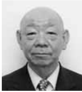
市民福祉部長 西方 文太郎