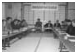
▲なお、このような集落営農組合は、弘戸湯端地区でも組織されています。

これは、平成19年度から実施される「品目横断的経営安定対策」に向けて組織されたもので、米、大豆を中心に地区内の農家がお互いに協力して農業経営の発展を図り、共同の利益を増進することを目的としています。