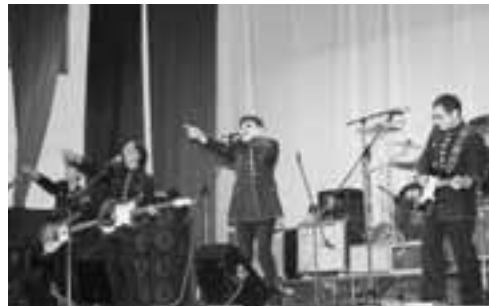
▲今回のテーマ「ともに輝け！中高年の星たち」の通り、ステージと観客が一体となり、ともに輝いたフェスティバルとなりました。

3月18日「テケテケサウンド」に魅せられた県内のアマチュアバンドが一堂に会し、秋田県エレキバンドフェスティバルが若美コミュニティセンターで開催されました。6回目の開催となった今回、地元若美ベンチャーズをはじめ、秋田市や北秋田市など県内各地から10組のバンドが参加し、息のあった演奏を披露しました。会場には、同じく「テケテケサウンド」を愛する約600人のファンが集まり、懐かしい曲に合わせて大きな手拍子が送られ、会場は熱気に包まれていました。