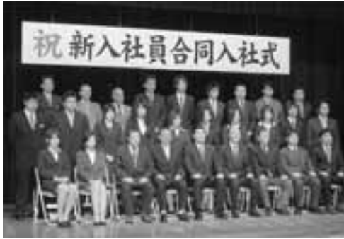
▲合同入社式には14名の新入社員をはじめ、就職先の事業所の方々も出席して行われました。