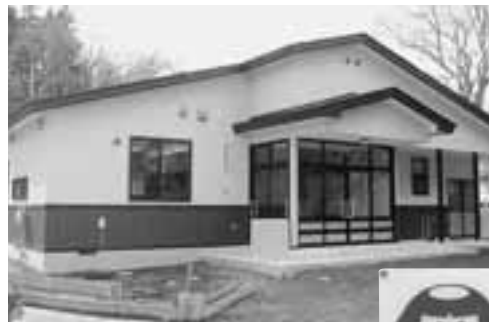
▲地域の皆さんのコミュニティ活動に活用されます。

財団法人自治総合センターでは、宝くじの普及広報を目的に、文化振興事業やコミュニティ助成事業などを通じ、地域住民が自主的にコミュニティ活動を行えるよう各種の事業を実施・支援しています。本市でもこの制度により、各種イベント用備品の購入をはじめ、数多くの事業を実施してきました。平成18年度は、道村地区にコミュニティ活動の活発化を図り、地域活動の拠点となる施設「道村地区コミュニティセンター」を建設しました。