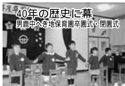
▲仲良しの5人組は最後に手をつないで、元気よくお別れの歌を歌いました。