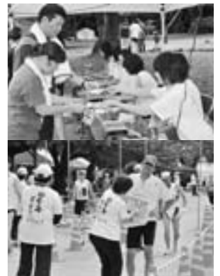
▲多くのボランティアに支えられています。

※ 参加料は、若美総合体育館で申込み時に直接納めるか、郵便局または定額小為替で納めてください。