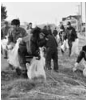
▲多くの市民の方々のご協力により、道路や湖岸はきれいになりました。

◆中学生の部 第1位/潟西野球レッドスターズ 第2位/潟西腹筋学園野球部 第3位/潟西陸上部 ◆一般の部 第1位/潟西クラブ 第2位/あおさぎ走友会 第3位/角間崎セブンスターズ