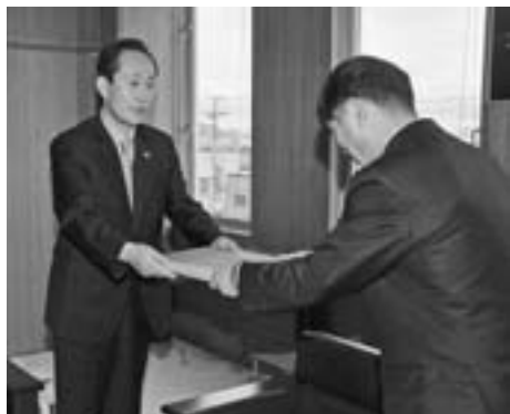
▲金支社長には、秋田杉で作られた委嘱状が手渡されました。

これに対し、金支社長は「韓国ドラマのIRIS（アイリス）効果により、韓国人観光客が増えている。口コミで男鹿の素晴らしさを広めていきたい」と抱負を語っていました。