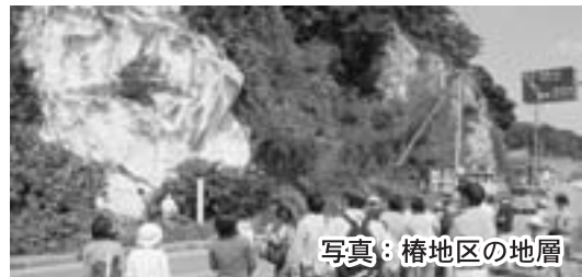
写真: 椿地区の地層