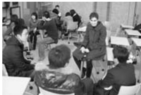
▲中学生は、3人1組で留学生と英語で会話をし、交流を深めました。

1月13日、市内の小・中学生42名が国際教養大学(秋田市雄和)を訪れ、留学生と一緒にゲームや会話を楽しみながら交流を深めました。これは、市内の児童生徒に国際感覚を身に付けてもらおうと国際教養大学と協定し、昨年からは始まった事業です。これまで2度留学生が男鹿市を訪れましたが、今回初めて児童生徒が訪問することとなりました。当日は、児童と留学生がグループを作り、カードゲームや世界各国の「こんにちは」などのあいさつを楽しみながら学びました。