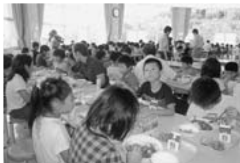
▲市内小・中学校の給食には、新鮮な男鹿産の食材を使用しています。

市では「食育」の観点から、学校給食に男鹿産食材を積極的に取り入れています。4月からご飯を1000g男鹿産米としているほか、旬の野菜や果物、男鹿で水揚げされた魚介類などの「男鹿のめぐみ」をふんだんに取り入れた給食を提供しています。また、地域の生産者らを招いて給食試食会を開催し、子どもたちに生産現場の生の声を伝えました。生産者がどんな思いで食材を育てているかを知ることによって、農・漁業への考えを深め、「食に感謝する心」も育まれることでしょう。