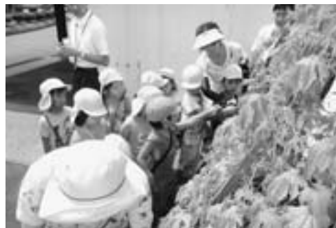
▲青々と実ったゴーヤを、興味深げに収穫する園児たち。

8月6日、船川保育園の園児たちが市本庁舎前に植えられたゴーヤの実を収穫しました。収穫したゴーヤは、ゴーヤチャンプルーとして園の給食時においしくいただきました。来年は、みなさんもチャレンジしてみませんか。