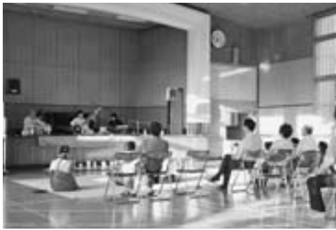
▲夕陽に照らされ茜色に染まる校舎に、幻想的なインド古典音楽が響きわたりました。

8月19日から21日にかけて、旧五里合中学校で「五里合ものづくり学校」が行われました。これは、画家や料理人、農家、音楽家、記者など秋田で暮らす20代から30代の若者で構成される「茄子地人協会」が、それぞれの生業を地域活性化に結び付けようと企画したものです。初日の「座談会・みんなで五里合づくり」から始まり、漫談や音楽ライブ、県内で活躍するアーティストの作品展「五里合琴川地区に伝わる「すげ笠づくり」実演などに、市内外からたくさんの方が参加がありました。