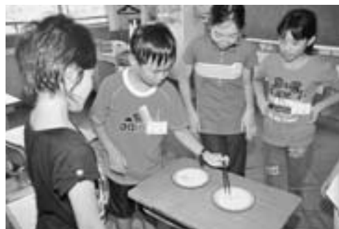
▲大豆を箸でつかむゲームを楽しんだ児童たち。(鶴木小にて)