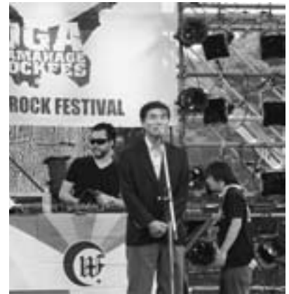
▲OGA NAMAHAJE ROCK FESTIVAL より

スポーツ、音楽など何でも早いうちに覚えた方がよいのですが、泳ぎは特にそうです。小学生のうちに泳ぎを覚える機会があれば習得は、だんだん難しくなります。