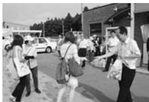
▲JR船越駅前では、保護司会、市民団体がPR用のリーフレットを配布しました。

当日は、男鹿地区の保護司会や市民団体、地元高校生による啓発活動が行われ安全で安心な暮らしができる地域社会づくりを呼びかけました。