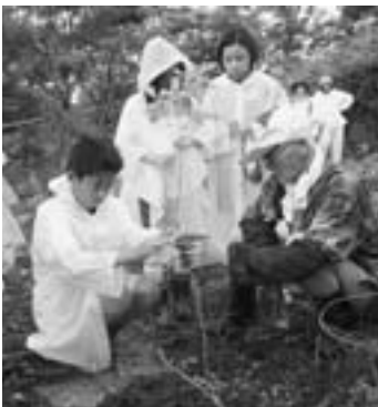
▲滝の頭水源植林の様子

◆寄附金は市政の推進に活用されます 寄附金は、滝の頭水源の環境保全事業など、市が取り組むまちづくりを推進するため、貴重な財源として幅広く活用されます。