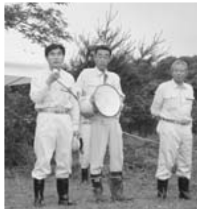
▲滝の頭水源植林にて