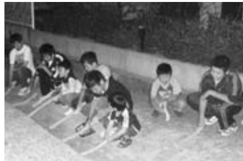
▲菖蒲をたたきながら子どもたちの元気な声で、邪気を追いはらいました。

6月15日(旧暦の5月4日)、船川港女川地区で「菖蒲(シヨウブ)たたき」行事が行われました。 幼児から中学生までの男子17名が参加し、菖蒲と蓬(ヨモギ)をワラで包んだ棒を手にとって、家々をまわりました。家人の許しを得ると、子どもたちは「5月4日の若菖蒲、だれっっちゃあられのとながらし！」(「誰に当たってもおとがめなし!」)の掛け声で、玄関先を10と1回、棒で叩きつけ邪気を追いはらいました。 この行事は、昭和30年代まで広く行われていましたが、市内では女川地区だけとなりました。