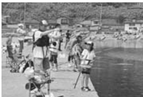
▲参加者は投げ釣りや浮き釣りなど、それぞれのスタイルで楽しみました。

6月13日、戸賀漁港で第11回親子釣り大会が開催され、市内外から61人の親子連れが参加しました。この大会は、(株)男鹿市観光協会が家族の絆を深めるとともに、男鹿の魅力を感じてもらうために毎年開催しているものです。アイナメやメバルなどの小魚が中心に釣れ、参加者からは釣りがるたびに大きな歓声があがっていました。また、今回釣れた魚は、男鹿水族館G.A.Oの職員によりその生態と特長について説明があり、参加した親子連れは興味深げに聞いていました。