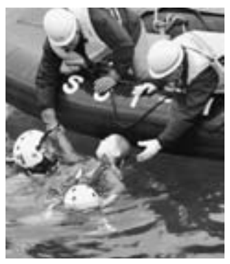
▲津波による海難救助救出訓練の様子。

5月26日、戸賀地区で男鹿市防災訓練が行われました。 これは、27年前の日本海中部沖地震を教訓に、防災対策の強化と地域住民の防災意識の高揚を目的として、防災関係者や住民など約440名が参加して行われたものです。 訓練は、「男鹿沖でマニチュード7・7の地震が発生し、戸賀地区で震度6強を観測。建物の倒壊・火災・ライフラインの損壊等が多発し、沿岸部には津波警報が発令された」という想定のもとで行われ、男鹿市災害対策本部設置運用訓練では、市長の指示により参加した構成員が関係機関の協力を得て災害応急対策活動を実施しました。 バケツリレーによる初期消火訓練は、街区火災の発生により地域住民がバケツなどを持ち寄って近くの水槽からリレーで運び消火を行うというもので、参加者は、万が一の事態を想定した大規模な訓練に真剣に取り組みました。