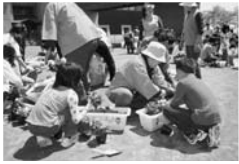
▲児童たちは、委員の方々から植え方を教わりながら丁寧に植栽しました。

5月31日、鶴木小学校で人権の花運動・植栽式が行われ、児童や市の人権擁護委員の方々がプランターにペゴニアの花を植栽しました。 この運動は、次の世代を担う子どもたちが、互いに協力して花を育てることで命の大切さや思いやりの心を育み、豊かな人権感覚を身につけてもらおうと、市や人権擁護委員協議会などで組織する秋田県央地域人権啓発活動ネットワーク協議会が毎年行っているものです。 植栽後のプランターは、地域行事などでの飾り付けにも利用されます。