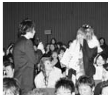
▲実行委員から突然質問され、とまどいながら答える出席者。

へへの感謝の気持ちを決して忘れずに、これからの未来に向かって歩んでいきます」と誓いの言葉を述べました。 このあと、中学時代の恩師からのお祝いメッセージやビデオレターの上映が行われ、懐かしい映像が流れると会場は大いに盛り上がりました。最後に、実行委員会が感謝の言葉を述べて式を閉じ、出身中学校ごとに記念撮影をしました。