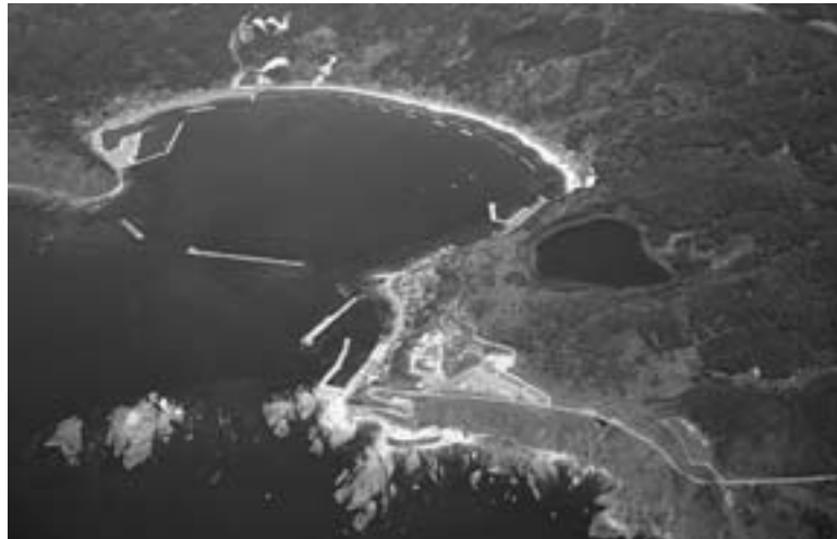
▲男鹿目潟火山群と戸賀湾

ジオパークは貴重な地形、火山、断層、岩石など地質遺産をテーマとした自然公園の一種です。講演会では2009年にユネスコ支援の世界ジオパークに認定された糸魚川ジオパーク（新潟県）で活動されている方々をお招きしてお話をうかがい、男鹿市などにおけるジオパーク認定に向けた活動の方向や取り組み方などを探ります。