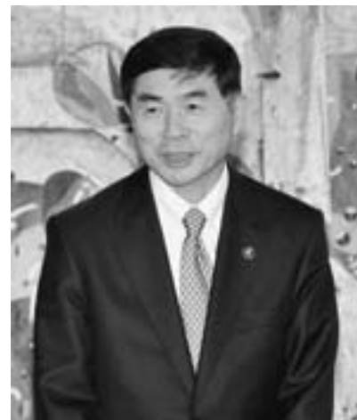
▲市長・ちびっこ座談会より