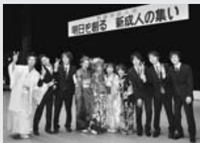
▲実行委員会の皆さん

成人式の開催にあたっては、新成人の中から代表10名が実行委員会をつくり、何度も話し合いを重ねて準備しました。実行委員会の皆さんの企画・運営で思い出に残る成人式になりました。