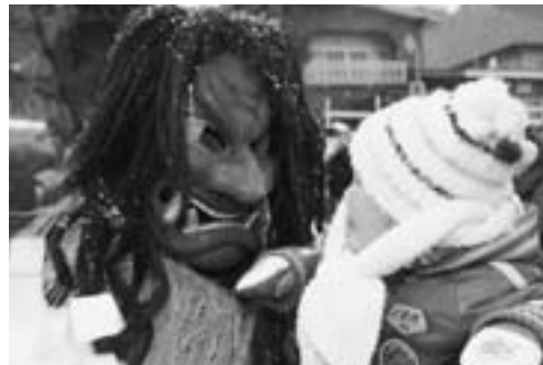
▲迫力あるなまはげの姿に、小さな子どもは声をあげて泣きじゃくりました。

12月31日、「市職員によるなまはげ行事」が市役所で行われ、大勢の見物人が訪れました。15時30分、ほら貝の音を合図に市職員が装った14匹のなまはげが下山を始め、市役所からJR男鹿駅までの道のりを練り歩きました。集まった見物人や列車の乗客に「泣ぐ子はいねがー」「言うごとく聞かぬがー」と叫びながら暴れまわりました。なまはげが市役所に戻ると市長との問答が行われ、最後に関係者が餅まきをして、新しい年の幸せを願いました。