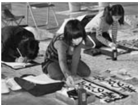
▶参加者は真剣な眼差しで、課題に取り組みました。

1月7日、第31回新春書き初め大会が、若美コミュニティセンターで行われました。大会には、市内の小中学生と一般の20人が参加し、それぞれ決められた課題に取り組みました。参加者は、「とめ」や「払い」などの一筆一筆に注意しながら、ていねいに作品を書き上げました。