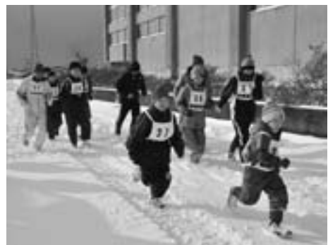
▶雪が降り積もったコースを完走しました。

1月1日、新春恒例の第26回若美元旦親子マラソン大会が行われ、市内外から11人の親子やマラソン愛好者が参加し、今年一年の走り初めを行いました。