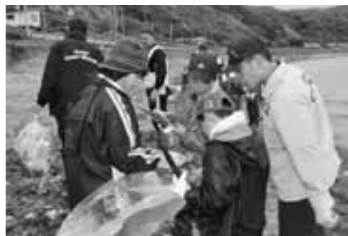
▲戸賀湾の波打ち際に寄せられた漂着ごみの一つ一つを分類しながら拾い集めました。

6月1日、戸賀公民館前の海岸で漂着ごみの実態調査が行われました。これは、秋田海上保安部が子どもたちに海の環境保全に関心を持ってもらうため、北陽小学校と協力し合い実施しているものです。参加した北陽小5・6年生31人の児童が、同海上保安部職員と一緒に砂浜に流れ着いたごみを拾い集め、その種類や数を調べました。ごみの多くはペットボトルやロープ、漁具などで、集められたごみの量は76.3キロもありました。今回分類されたデータは、今後の海洋汚染対策に活用されます。