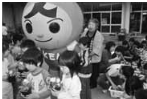
▲ベゴニアの苗をプランターに植え替える児童を見守る「人KENまもる君」。

6月4日、「人権の花」運動として船越小学校の全校児童358人が、ベゴニアの苗540本を植えました。この運動は、子どもたちが互いに協力し合いながら花を育てることで、命の大切さや思いやりの心をはぐくむことを目的に、県中央人権啓発ネットワーク協議会(秋田地方事務局、秋田人権擁護委員協議会ほか)が実施しています。児童たちが学年ごとに二人一組になり、「みんなが幸せに生きていけるように」と願いを込めて植えられたベゴニアの苗は、船越小の玄関前に大切に飾られています。