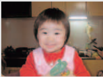
最近、いっぱい食べるようになったね。これからも沢山食べて、大きくなってね。

「わが家のアイドル」を募集しています。 写真にメッセージ(60文字程度)を添えてお寄せください。 ※写真は、電子データでも結構です。また、返却を希望される場合はその旨をお知らせください。 〒010-0595 男鹿市船川港船川字泉台66の1 男鹿市役所企画政策課広報統計係 ☎23-21111 (内線3107)