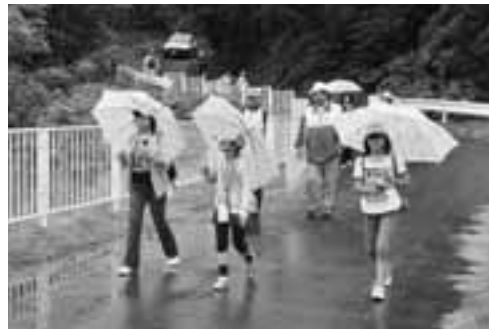
▲ウグイスやカッコウなどの鳥のさえずりを聞きながら、ウォーキングを楽しみました。

6月6日、若美中央公園周辺の特設コースを会場に、健康ウォーキングinわかみが開催されました。当日は、朝から小雨が降りしきる天候となりましたが、45人もの親子連れが参加しました。ウォーキングは、約5キロのコース図に従って、ポイントごとの簡単な問題を解きながら歩く「ウォークラリー」形式で行われました。途中、指導員から四つ葉のクローバー探しや草笛の吹き方などを教わり、参加した子どもたちは目を輝かせながら、自然と触れあった一日となりました。