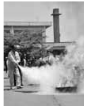
▲油火災を想定した消火器による初期消火訓練も行いました。

5月26日、26年前の日本海中部地震の大惨事を教訓に、防災対策と防災意識を高めるために定められた「県民防災の日」に、若美地区で男鹿市防災訓練が行われました。 訓練には、地域の住民や市消防団をはじめ、男鹿地区消防本部、航空自衛隊加茂分屯基地第33警戒隊など関係者約700人が参加し、災害時の初動対応について確認し合いました。 午前9時55分、男鹿沖を震源とするマグニチュード7.7の地震が発生し、震度6弱の揺れを観測した若美地区内では、建物の倒壊や火災、ライフラインの損壊が多発したとの想定で訓練が開始されました。 液状化現象により建物が大きく傾いた鶴木小学校では、大型高所放水車が出動し、逃げ遅れた人を屋上から救出する訓練やプールでおぼれている人の救助訓練が行われました。 建物火災への地域住民によるパケツリレーでの初期消火活動、市消防団による土砂崩れを防ぐ水防訓練、企業局によるガス・水道のライフラインの復旧訓練など、地震によるさまざまな被害を想定しての訓練に参加者は真剣に取り組みました。