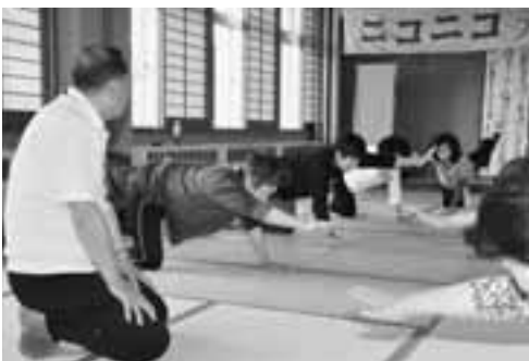
▲簡単な屈伸運動だけでも、体の動きがスムーズになりました。

体を軽くしたいたり、足首やひざの屈伸運動をしたりして全身に血液をめぐらせ、参加者からは「体操前より体が柔らかくなった」と笑みがこぼれていました。この体操は、若美公民館では毎週水曜日、船川北公民館では木曜日、船川港公民館では金曜日に開催しています。