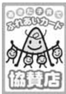
▲協賛店のステッカー。お店によりさまざまなサービスがあります。

▼問い合わせ／子育て支援課 ☎23-2111 内線2906 http://common.pref.akita.lg.jp/k-yutai/