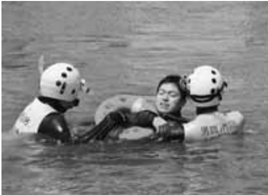
▶ 鶴木小学校のプールでは、海や川などでおぼれた人の救助や水中に沈んでいる人を検索する水難救助訓練が行われました。