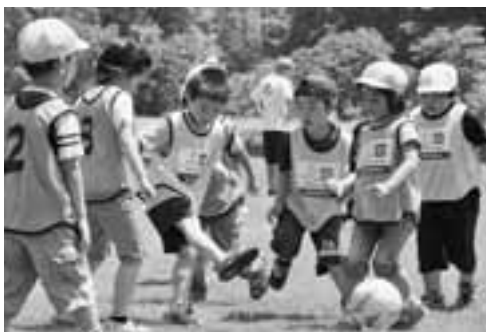
▲コロコロと転がるボールを夢中になって追いかけていました。