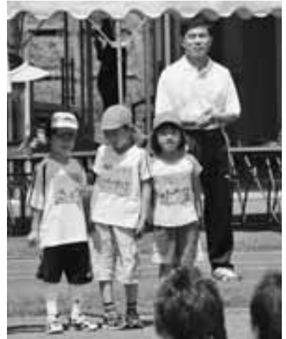
▲チビッツサッカーフェスティバルにて