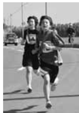
桜舞うコースを力走 若美親善駅伝大会

4月29日、第51回若美親善駅伝大会が行われました。 この大会は、若美地区の祭典にあわせて行われているもので、午前8時30分に地区の北端にある五明光をスタートし、南端の小深見を折り返して、若美庁舎前をゴールとした約26キロの特設コースで競いました。 中学生の部に4チーム、一般の部に5チームのほか、オープン参加として男鹿東中学校の女子だけで結成された2チームの計11チームが参加し、沿道からの声援を受けながらたすきをつなぎました。