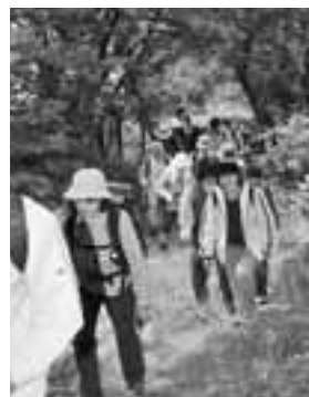
▲やわらかな木漏れ日がさすブナ林の中を歩きました。

5月16日、古くから信仰の対象とされてきた男鹿三山（毛無山645㍎、本山715㍎、真山567㍎）を縦走する、男鹿探勝「お山かけ」が開催されました。