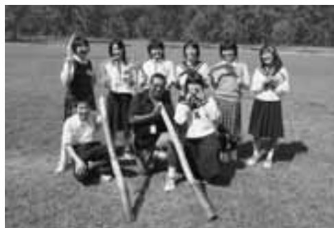
▲オーストラリアの先住民族、アボリジニの文化も学びました。

ホームステイや学校で学んだこと、日本との文化の違いを肌で感じたことなど、短い期間での貴重な体験に一同が自分を大きく成長させてくれた研修であったと報告しました。