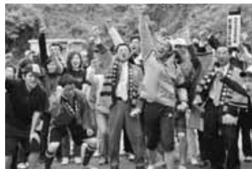
▲さあ走るぞ！と気合いを入れて47人のランナーが「五風」前を出発しました。

5月14日、タレントの森脇健児さんと走る青春ジヨギング番組「走る男II」の撮影が男鹿を舞台に行われました。必ず100人のご当地ランナーと走らなければ各県をクリアできないというルールですが、当日は男鹿温泉交流会館「五風」前に、47人ものランナーが集まりました。スタート直後、突然の激しい雨に一時中断するアクシデントもありましたが、ゴール地点の入道崎までの約7キロを走りました。放映は、BS11（日本BS放送）にて6月上旬の日曜日、12時からの予定です。