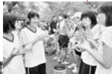
36キロペアマラソンでは、手をつないでゴールするのがルールです。

● 一般男子の部 (18歳〜39歳)、 (40歳代の部)、(50歳代の部)、 (60歳以上の部)