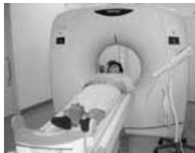
▲従来に比べ、撮影は短時間で終わるため、体への負担が大幅に減りました。

男鹿みなと市民病院では、このたびマルチスライスCTを導入し稼働しています。CT検査とはX線を使って体の断面を撮影します。今回新しく導入したCT装置には検出器が16列もあり、このように検出器が多数あるCT装置をマルチスライスCTといいます。