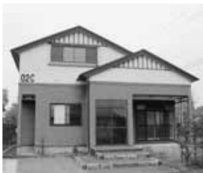
▲市営住宅諸産堤団地