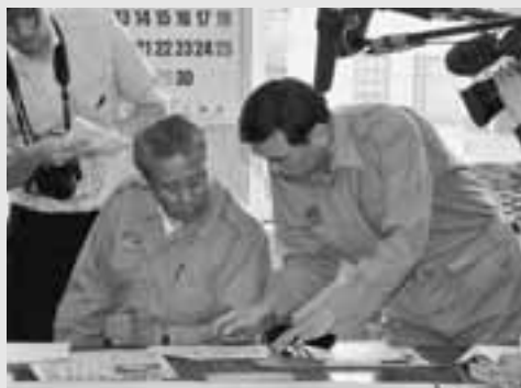
▲発射通告のあった4月4日から5日にかけて、張り詰めた緊張感の中で、迅速で的確な対応にあたりました。

その後、二段目は秋田・岩手両県の上空を通過しましたが、幸い落下物も被害もなく、大事に至らなかったため、翌6日の午前8時35分に飛翔体対策警戒部を解散しました。