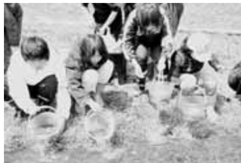
▲児童たちは、サケが少しでも多く帰って来られるように元気よく送り出しました。

4月9日、野村川サケふ化場で、北陽小学校の5年生10人がサケの稚魚を放流しました。 稚魚は野村川の上流から放流されるとアラスカまで4000キロメートルの距離を泳ぎ、そして3年ほどかけて約3000倍の重さに成長し、男鹿へと戻ってきます。 児童たちは、小さなサケの稚魚が酸素やエサを得るために、川の流れに逆らって泳ぐ習性や星の位置から自分の居場所が分かることなどの新しい発見があり、学ぶことの多い放流体験となったようです。