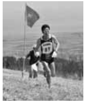
▲こんなに傾斜角度の大きい所もコースの一部となっています。

4月19日、第45回全県クロスカントリー大会が寒風山特設コースを会場に開催されました。この大会は、男鹿の春を告げる風物詩として、またランナーにとっては今年のシーズンを占うものとして定着しており、小学生から一般までの10部門に市内外から88人が出場しました。 例年、冷たい風が吹くため肌寒く感じることも多いのですが、今年は朝から晴れ渡り、春らしい爽やかな風に包まれ、ランナーたちは心地よい汗を流していました。 レースでは起伏の激しいコースに時々足をとられる人もいるなど、刻々と変化する展開に観客から大きな声援を受けていました。