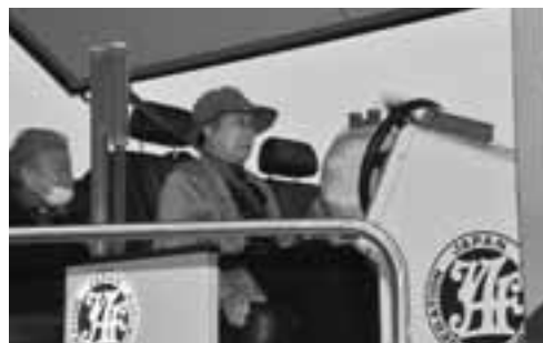
▲シートベルトを着用したときは、座席から体が浮かなかったため、改めてその効果を感じていました。