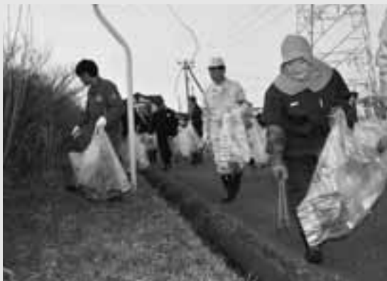
▲渡部市長も市民と一緒に、八郎湖岸のごみを拾い集めました。

男鹿の豊かな自然をより美しく保つため、また自分たちのこども、そして未来のために「ごみは捨てない、持ち込まない」ことを心がけたいものです。