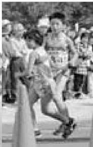
▲男鹿市チーム2区へのタスキリレー

来年の第4回大会は、男鹿市で開催されます。詳細が決まり次第、広報でお知らせしますので、来年の大会では沿道から地元チームへたくさんの応援をお願いします。