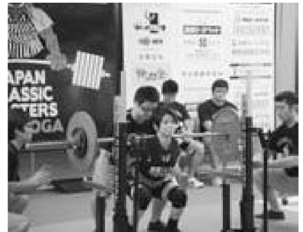
▲バーベルを肩に乗せ全力で持ち上げる選手

9月24日から27日までの4日間、男鹿総合運動公園陸上競技場と同球技場、OGAマリンパーク球技場を会場に日本スポーツマスターズ2016秋田大会サッカー競技が開催されました。