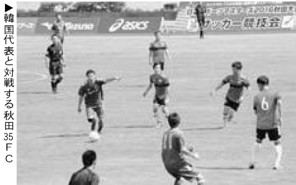
▶韓国代表と対戦する秋田35FC