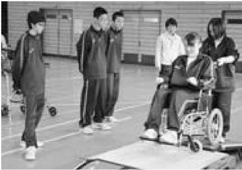
▲軽々と坂道を登る電動アシスト車いす

10月14日と15日、潟西中学校の3年生24人が「高齢者福祉に焦点を当てて」をテーマに認知症サポーター養成講座と家族介護の体験学習を行いました。14日に行われた介護体験では、ベッド上での介助や車いすの操作、生活動作が容易に行える自助具や福祉用具の使用、認知症診断につながるテストを体験し、生徒らは「車いすで介助される際、恐怖感があった。相手の気持ちを考えて介助する大切さがわかった」、「介護の負担軽減につながる福祉用具を知り、介護している家族に伝えたい」と話しました。