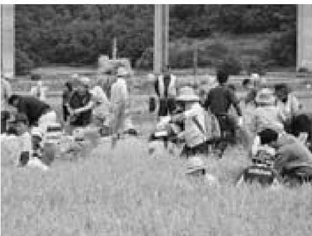
▲手刈りでの稲刈りを楽しむ参加者の皆さん

10月2日、安全寺地区で農作業体験などの里山の美田オーナー稲刈り&サツマイモ掘り体験が行われました。 今年5月に田植えを行った田んぼが収穫期を迎え、安全寺保存会が行っている里山の美田オーナーや地域の方々など約160名の参加者が、黄金色に実った稲を手で刈り取っていききました。昼食には安全寺産米のだまこもちが振る舞われたほか、午後からはサツマイモ掘り体験が行われ、参加者は秋の休日を楽しんでいました。