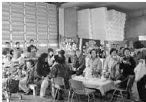
▲たくさんの来場者でにぎわった漁業祭

北浦総括支所女性部が主催し、北浦金曜市、火曜市の皆さんが協賛して行われた漁業祭では、地元の魚介類を使用した加工品や鮮魚のほか、野菜や日用品などが販売されました。たくさんのお客さんが来場され、会場では、来場者全員に無料のサケ汁が振る舞われたほか、多くの商品が完売するほどの盛況ぶりでした。