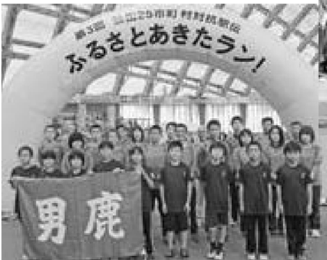
▲駅伝に参加した男鹿市チームの選手たち