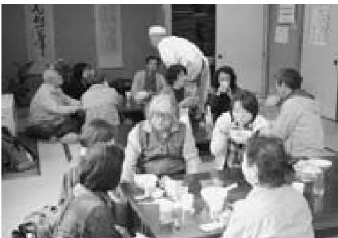
▲浜のそばを堪能する参加者の皆さん

10月22日、男鹿中浜間口で今年の秋に収穫された新そばと「こおひい工房・珈音(かのん)」のコーヒーを味わう、浜のそば収穫祭が行われました。