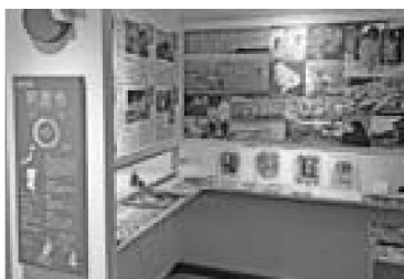
▲開設した男鹿市ブース