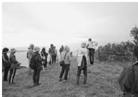
▲城跡から脇本地区を眺望する参加者

脇本城跡は、日本海に突き出すようにそびえる標高約100mの丘陵地に築かれた城跡で、平成16年に国の文化財に指定されている史跡です。案内人は「脇本城跡には、土塁や井戸跡など城のあった遺構がきれいに整備されています。皆さんも城のあった時代を想像してみてください」と話しました。