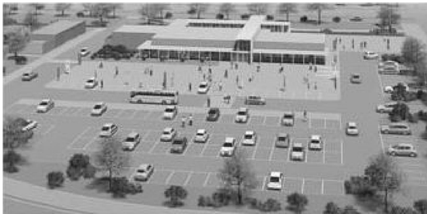
▶外観図 ※基本計画時のイメージです