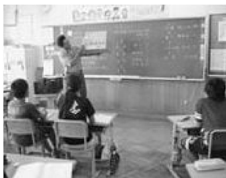
▲カボチャの先生との授業

今年度は、地域に開く学校を目標に取り組んでいます。10月19日には、地域からの提案で学校を会場にジャズピアノコンサートを実施しました。地域の方々による支援も広がり、カボチャづくりや家庭科のミシンの指導、交通安全看板づくりもしていただきました。特にカボチャづくりでは流通までの学習を行うなど、地域の先生のおかげで、学校だけではできない学習を行うことが可能となりました。