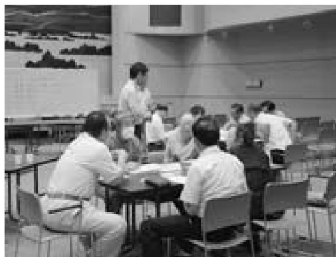
▲テーマごとに分かれ行われたグループ討議

9月28日、市民文化会館において男鹿市の生涯活躍のまちワークショップ「第1回男鹿のまちづくりを考える会」を開催しました。