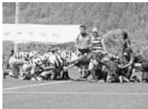
▲手に汗握る攻防を繰り広げる選手たち