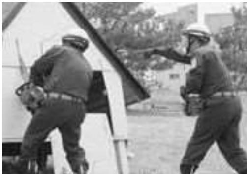
▲倒壊家屋救助救出訓練を行う消防団員

秋田県沖を震源とする海溝型運動地震が発生し、大津波警報が発表されたとの想定で始まった訓練では、地域住民による津波避難訓練や消防団による資機材を活用した倒壊家屋救助救出訓練などが実施されました。椿公民館では、日産自動車株式会社から貸与していただいた電気自動車を活用した給電訓練や避難所運営訓練など、住民参加型の有意義な訓練となりました。