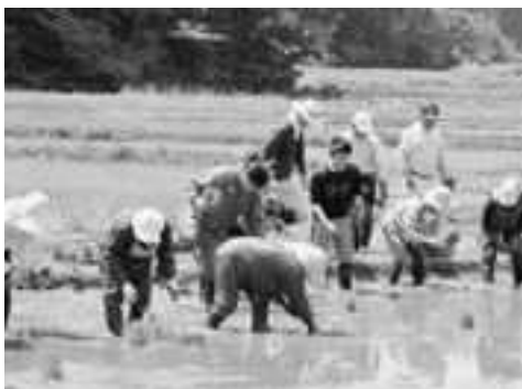
▲美田オーナーと地域の方々による田植え

安全寺地区での農作業体験や交流会を通じ、地域の皆さんと一緒に里山の田んぼを保全していくサポーター（オーナー）を募集しているもので、当日は県内外から約130人が参加し、地域の方々に講師に田植えやかかしづくり体験を楽しみました。参加したオーナーの皆さんは、秋に予定している稲刈り体験も心待ちにしている様子でした。