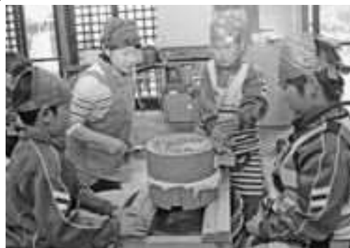
▲一生懸命、重い石臼をひく児童たち