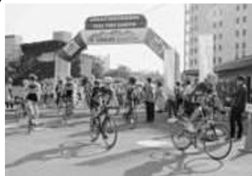
▲一斉にスタートするロングコースに参加した皆さん

5月28日、29日の両日、男鹿市内全域をコースとし、第2回男鹿半島なまはげライド2016が行われました。