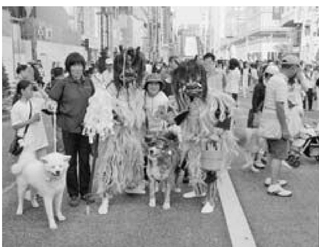
▲銀座の歩行者天国で男鹿をPRするなまはげ

15日は、銀座紙パルプ会館で、なまはげや秋田犬との交流、海産物やしょつたるなど特産品の販売や移住相談会などを行い、男鹿を全国へPRしました。