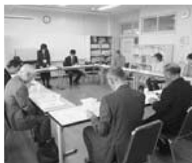
▲第1回学校運営協議会のようす（弘戸小学校）

4月1日、教育委員会は市内全小・中学校をコミュニティ・スクールに指定しました。これを受け、各学校では学校運営協議会の設置により、地域との連携による新たな学校づくりが始まりました。 第1回学校運営協議会では、校長先生が学校経営計画を説明した後、