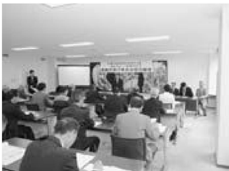
▲設立総会・第1回総会

5月17日、平成29年度に開催される「ねんりんピック秋田2017」男鹿市実行委員会設立総会・第1回総会が開かれ、市では男鹿総合運動公園を会場にラグビーフットボールとミニテニスのふれあいスポーツ交流大会を実施することが確認されました。総会では、今年度の事業計画として、9月11日に行う種目別リハーサル大会の概要や今後のスケジュールなどについて話し合われました。