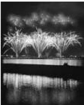
▲昨年度の男鹿日本海花火フォトコンテスト金賞作品