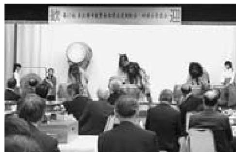
▲アトラクションでなまはげ太鼓を披露する男鹿北中の生徒

4月21日、第67回東北都市教育長協議会総会が東北52市の教育長参加のもと、市内ホテルで行われました。総会終了後のアトラクションでは、男鹿北中の生徒13名がなまはげ太鼓を披露し、参加した各教育長からは絶賛の声があがりました。