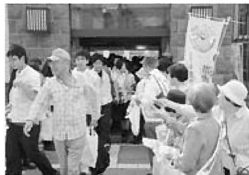
▲男鹿駅の乗降客に呼びかけを行いました

これは毎年7月に行われているもので、犯罪や非行の防止と罪を犯した人たちの更生について理解を深め、それぞれの立場で犯罪のない地域社会を築こうとする全国的な運動です。この機会に自分には何ができるか、皆さんで考えてみませんか。