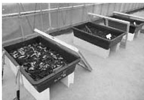
▲ビニールハウス内での堆肥化への実証実験

はじめは学校給食の生ごみを活用し、条件を変えながら堆肥化の可能性を探り、その後モデル地区の一般家庭の生ごみでも実験を行っていきます。