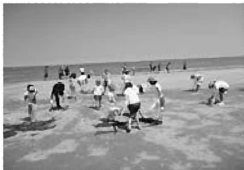
▲みんなで海岸をゴミ拾い

7月5日、コスモアースコンシャスアクトクリーンキャンペーンin男鹿において、野石小学校や男鹿海洋高校の生徒、市民など約600人が参加して宮沢海水浴場の清掃活動を行いました。 また、7月23日には、ほけんの窓口グループ株式会社がキックオフミーティング2014 in 秋田において、ミーティングに参加した約300人の方々や戸賀湾などの清掃活動を行いました。