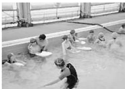
▲泳ぎ方を教わる児童たち

この教室は小学生の体力向上を推進するため、25歳を泳ぐことを目指しているもので、参加した児童らは、元国体選手や日本体育協会認定の水泳指導員などからビート板を使った泳ぎ方の基本やクロールの泳ぎ方などを教わっていました。