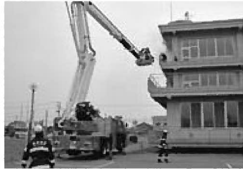
▲高所はしご車による救出救助訓練