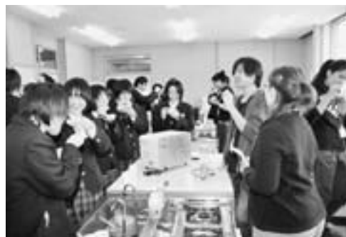
▲ワークショップでは、ホットココアやクッキーを留学生と一緒に作って食べました。

2月10日、国際教養大学（秋田市雄和）の留学生との交流会が男鹿北中学校で行われました。この事業は、外国人留学生との交流を通じて、生徒が外国の文化や習慣に触れることで理解を深め、英語学習への興味関心を高めることを目的に行われています。ワークショップでは留学生が出身国や郷土料理、学生生活などを紹介。生徒たちは、積極的に英語で質問する姿が見られました。また、ワークショップ終了後には留学生が和太鼓を体験し、楽しみながら文化交流を深めました。