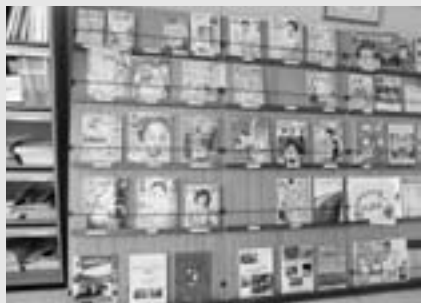
雑誌展示コーナー (新着本以外は貸出可能です)

書架にご希望の本がなくてもあきらめずにカウンター職員にお話してください。探してご連絡いたします。