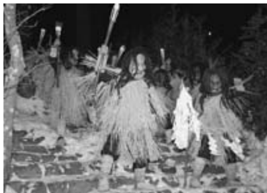
▶参道入口の石段にて、なまはげ入魂の儀式が行われ、なまはげの「ウォー」という雄叫びとともに、まつりが始まりまし