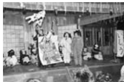
▲北陽小学校児童による子供なまはげでは、児童が調べた「なまはげ」について元気よく発表しました。

みちのく五大雪まつりの一つ「第49回なまはげ柴灯まつり」が、2月10日から12日にかけて、北浦真山神社を会場に開催されました。はじめに、北陽小学校の3年生12人が自作のなまはげのお面をつけ、学校の総合学習で調べた「なまはげ」について発表。なまはげの由来や所作などについて元気よく発表して、会場を盛り上げました。 境内が闇に包まれ、野太いほら貝の合図とともに、なまはげに扮する若者たちが参道に集まり、神官より神（しん）の入った面を授かる儀式「なまはげ入魂」で幕を開けました。神楽殿では「なまはげ行事再現」や「なまはげ太鼓」、市内各地区で特色のあるなまはげが紹介されたほか、柴灯火の前では勇壮ななまはげ踊りが披露され、観客を魅了しました。まつりのクライマックス「なまはげ下山」では、たいまつのみかりで幻想的に映し出されたなまはげが雪山から降りて境内を練り歩いたあと、柴灯火で焼かれた護摩餅が来場者に振る舞われました。