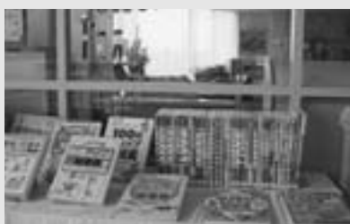
ウィンドディスプレイと展示コーナー