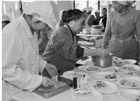
▶「鯛のしょつるバター蒸し」では季節ごとに魚と野菜をアレンジすると食卓が豊かになると好評でした。