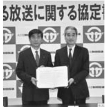
▲「災害時における放送に関する協定書」調印式にて。

鹿兒島市で開催された全国都市問題会議に参加しました。今回のテーマは「都市の魅力と交流戦略」です。