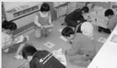
児童閲覧コーナーで本を読む子どもたち