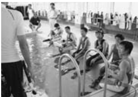
▲潜水実習の様子。生徒たちは、震災以来となる実習に、目を輝かせながら取り組んでいました。