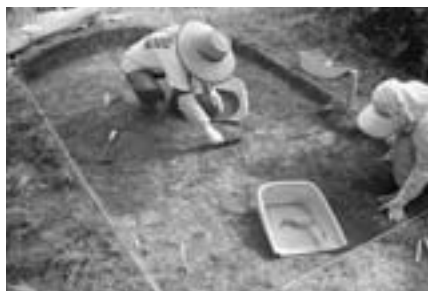
発掘調査のようす

中世の山城跡で郷土の歴史を学んでみませんか。今年度は、建物跡や盛り土の跡など多くの遺構が見つかっています。ぜひ、ご参加ください。