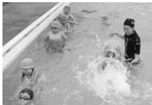
▲ビート板を使ったバタ足練習の様子。

7月25日から8月5日までの10日間、B&G海洋センターで子ども水泳教室が行われました。 これは、市内児童を対象に、体力と水泳力の向上を目的として市が実施したもので、指導者として株式会社秋田魁新報社と秋田県水泳連盟から派遣を受けました。 8月2日に行われた中級・上級者クラスの教室では、準備体操に始まり、息継ぎや手で水をかく練習などが行われました。 この教室に参加した児童、計482名には修了証が交付されています。