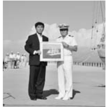
▲日本丸入港セレモニーにて、大藤高広船長より記念品を受け取る市長。

船川港築港100周年記念事業の一環として、帆船「日本丸」が船川港に入港してくれました。