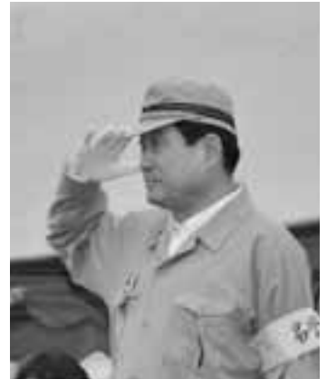
▲男鹿市防災訓練にて(5月26日)

▼6月14日朝の岩手・宮城内陸地震は、市民の皆さんも驚いたことと思います。私も日本海中部地震を思い出し、揺れがこのまま静まるよう祈っていました。その後、続々入る情報は皆さんもご承知のとおりです。県からの要請で消防本部の化学消防車、高規格救急車、広報車が奥州市に出動し、17日の午後戻って来ました。署員の皆さんご苦労さまでした。亡くなられた方々や災害に遭われた方々に心よりご冥福とお見舞いを申し上げます。私から奥州市、栗原市、大崎市のそれぞれの市長にお見舞いの電話を入れ、何か支援することがないかと申し上げました。本市では、下水道の管が二方所被害を受けました。日ごろから災害に対する準備を怠らないよう心がけましょう。