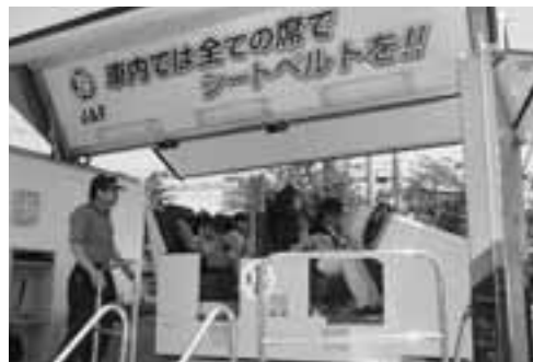
▲シートベルト、チャイルドシート着用の習慣が不測の事故から身を守ります。

6月20日、船越保育園で交通安全教室が行われました。この日はフリールも一緒に安全な道路の渡り方、チャイルドシート、シートベルトの正しい着用の仕方を教わりました。衝突体験車を使って時速5kmの衝突体験をした園児たちは、衝撃の大きさに驚くと同時に、チャイルドシートの役割と大切さを学びました。保育園では「交通ルネサンス秋田2008運動」のチャイルドシート使用モデル保育園の指定を受け、早朝の街頭指導にも熱心に取り組んでいます。