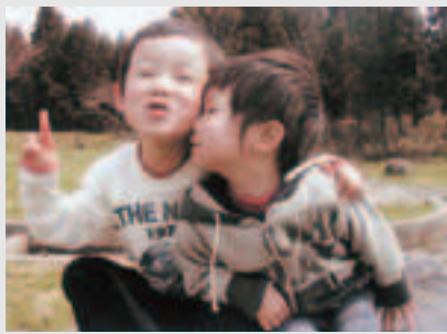
ケンカも多いけど、ホントは仲良しの二人です。 ずっと「めんこ」でいてね!