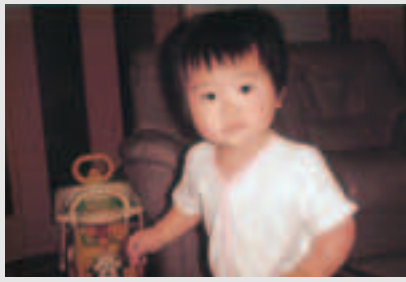
ヨタヨタしながらも、上手にあんよができるようになりました。早く靴を履いて、お父さんとお母さんと三人で外を散歩しようね。 心の優しい女の子になってね。