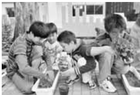
▲ベゴニアの苗は上級生と下級生と一緒に、一つひとつ丁寧に植えました。

6月2日「人権の花」運動として脇本第一小の全校児童200人が、ベゴニアの苗300本を植えました。 この運動は、花を植えることで命の大切さや思いやりをはぐくんでもらうことを目的に、秋田県央地域人権啓発ネットワーク協議会(秋田地方事務局、秋田人権擁護委員協議会ほか)が実施している運動です。 児童たちは上級生と下級生が三組になり、赤・白・ピンクのベゴニアの苗をプランターに植えました。 この日植えられたベゴニアは、脇一小の玄関前に飾られ、児童たちがお世話をし、生長を見守ります。