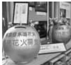
▲募金箱は、市内の店舗や各出張所に設置しています。