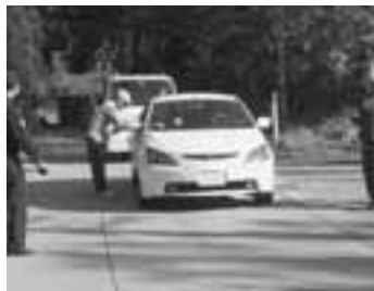
▲5月18日に、男鹿中自衛隊道路と本山・毛無山山頂進入路で、通行車両に啓発のチラシを配布し、自然保護とごみの持ち帰りを呼びかけました。

廃棄物の処理および清掃に関する法律では「何人も、みだりに廃棄物を捨ててはならない」と規定されています。違反した場合は「5年以下の懲役、もしくは1000万円以下の罰金に処し、またはこれを併科する」と厳しい規定を設けています。