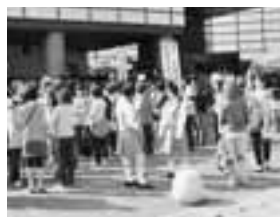
▲先行販売約5分で完売してしまったチケットを手に、待ちきれない様子。