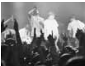
▲曲にあわせ、歌ったり、全身でリズムをとったり、それぞれの楽しみ方でライブを満喫していました。