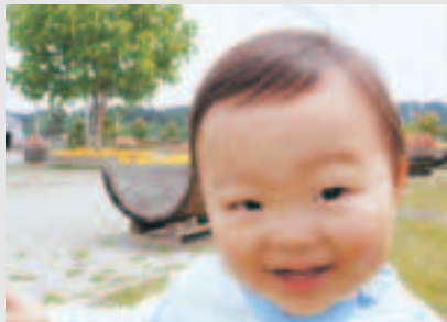
外で遊ぶの大好きな男の子です。朝から「くちゅ～(靴)」と言って、外へ繰り出します。たくさん歩いて、いろんな所へ行こうね。