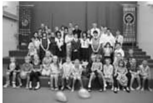
▲生徒たちは、人々とのふれあいを通して、たくさん学ぶことができました。

3月24日から31日まで8日間の日程で、市内の中学生8名が、オーストラリア・シドニーで研修を行い、その報告会が4月30日に開かれました。報告会では、一人ひとりが研修前に決めた「福祉」「環境」「観光」のテーマについての調査結果を発表しました。オーストラリアの現状や取り組みを見ての男鹿市への提言などのほか、ホームステイ先や学校での思い出の発表がありました。生徒たちはこの研修で、日本とオーストラリアの違いを肌で感じ、たくさん貴重な体験を得ることができました。