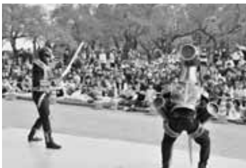
▲大人も子どもも、ネイガールの活躍に釘付けでした。

2回戦／男鹿南中 4対1 大曲中 準決勝／男鹿南中 1対0 城南中 決勝／男鹿南中 2対1 湯沢北中