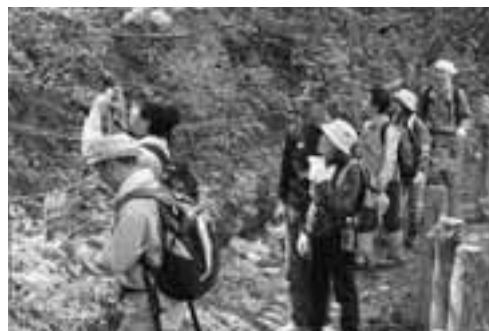
▲男鹿の自然美を丸ごと楽しめるということで、お山かけは大変人気があるそうです。

5月10日に、今年で33回目となる男鹿探勝お山かけが開催されました。午前9時に門前の五社堂前で出発式を行い、全行程約10kmの道のりを県内各地から参加した総勢204名が探勝しました。この日は暖かく、お山かけにはうってつけの気候。海岸線美や寒風山、入道崎を望み、山野草を見つけては写真撮影をしながら全員が自分たちのペースで楽しく歩きました。 この日の参加者の最年長は79歳、最年少は5歳と幅広い年齢の方が楽しめる、男鹿三山の無理のないコースも、お山かけの魅力の一つです。