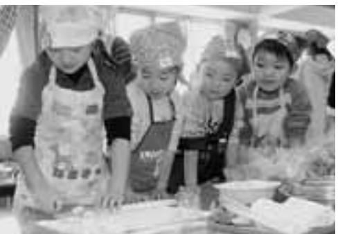
▲包丁を上手に使って野菜を切りました。