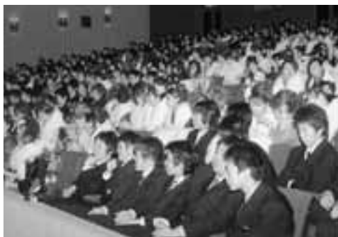
▲希望を胸に、大人としてのスタートラインに立った新成人の皆さん。

新生「男鹿市」となつて初めての成人式「明日を創る新成人の集い」が、1月8日、市民文化会館で行われ、会場に集まった新成人は再会した友達と写真を撮ったり、昔話などに花を咲かせて旧交を温めました。今年成人を迎え、晴れて大人の仲間入りをした市内の対象者は338人。このうち、316人が色鮮やかな振袖やスーツに身を包み出席し、20歳の門出を喜ぶとともに大人としての責任を自覚して、人生の新たな一歩を踏み出しました。