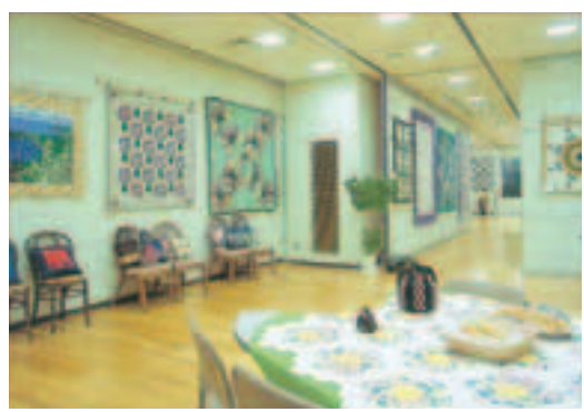
皆さんの作品の展示など幅広い利用が可能なギャラリー

館内の1階には、32インチテレビを配置し、少人数・小グループで演奏会など自由に利用できる「サニールーム」、127席の客席を配置し、演奏会やパネルディスカッション、カラオケ大会、各種発表会などに利用可能な舞台設備を完備した「ホール」、遊具を配置し子供の遊び場として最適な「プレイスペース」、各種合やグループのお稽古などに利用できる水屋つきの12畳の「和室」、軽食や飲食でくつろげる空間「喫茶たいむ」があります。また、2階には作品展示や会議室などに広く利用できる「ギャラリー」、楽器演奏やカラオケなどに利用できる防音設備の整った「練習室」など市民の皆さんが気軽に利用できる設備が満載です。