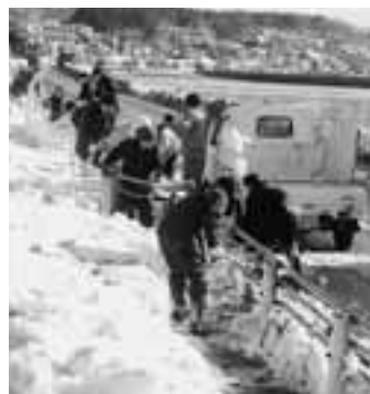
▲春先を思わせる晴天のなか、参加した皆さんは、心地よい汗を流しました。

1月15日、翌日から始まる小・中学校の児童・生徒の通学路を確保するため、全市一斉除雪を行いました。午前9時、各小・中学校にはスコープやスノーダンプを手にしたPTA関係者や市職員、地元の消防団をはじめとする地域の方々が集まり「子どもたちの通学路の確保」を合言葉に、除雪作業が始まりました。歩道には、降り積もった雪が50センチ以上ありましたが「かき出す」「積む」「運ぶ」と、集まった皆さん一人ひとりが、自ら進んでそれぞれの役割をこなし、作業は順調に進みました。作業も終盤にさしかかり、通学路、歩道の確保が目前に迫ったころには、心を一つに作業を進める皆さんの動きが力強さを増し、「通学路確保」の目標を達成した時には、疲労感よりも充実感と達成感に満ちた笑顔があふれていました。 この日の一斉除雪には、多くの市民の皆さんからご協力いただきました。ありがとうございました。