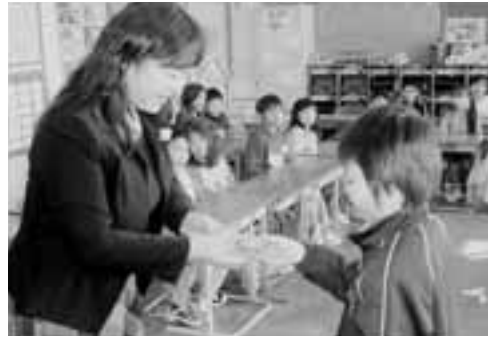
▲児童一人ひとりに、担任の先生から防犯ブザーが手渡されました。

※14時30分からは、男鹿市芸術文化振興大会を行います。芸術文化協会加盟団体の皆さんによる舞台発表などが行われますので、お気軽にお越しください。