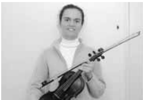
▲皆さんと一緒に勉強や交流することを楽しみにしています。

アグネスさんは「学校での授業や、市のいろいろな行事を通じて皆さんと交流し、男鹿の良さを発見したい」と、今後の抱負を語っていました。