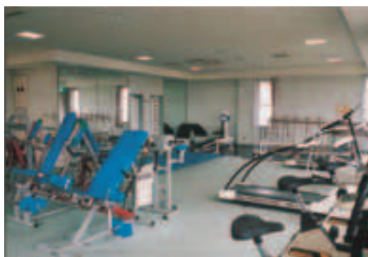
▲豊富なトレーニング機器を配置したトレーニングセンター