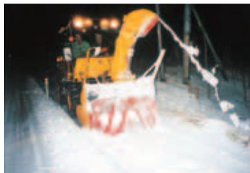
▲歩道の除雪作業は、ロータリー除雪車でを行っています。

この日委嘱された方々は、普段私たちが通勤や通学で使用する生活道路の安全を確保するため、昼夜を問わず除雪作業を行います。違法な路上駐車や道路上の障害物は、作業の大きな妨げになるばかりでなく、重大な事故につながる恐れがあります。除雪作業を安全、迅速に行えるよう、皆様のご協力をお願いします。