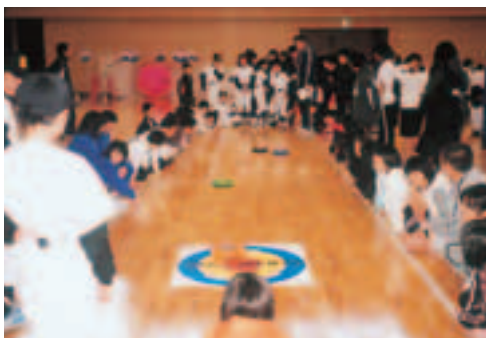
▲氷上のチェス「カーリング」からヒントを得て生まれた「カローリング」に興味津々。

12月10日、市総合体育館で、市内13のスポーツ少年団が参加して「第9回男鹿市ちびっこスポーツの集い」が行われました。ドリブル競争リレーや長縄跳びなど、楽しみながらできる種目が多く、館内には児童たちの歓声が響いていました。また、ニュースポーツのカローリングやユニバーサルホッケーなども紹介され、児童達はスポーツ・レクリエーションを通じて、同年代の仲間との交流を楽しんでいました。