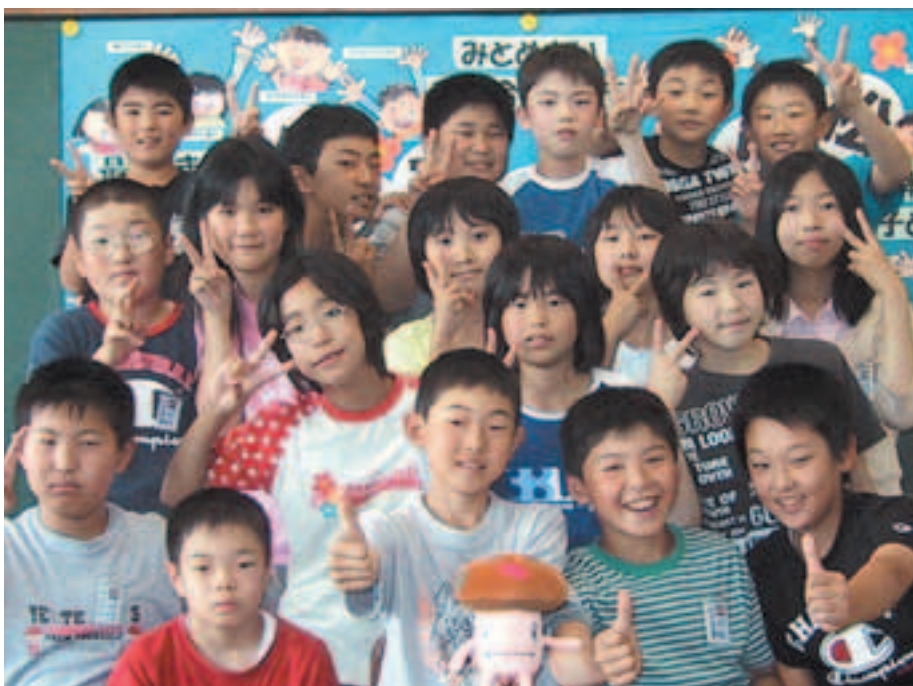
平成6年生まれ 五里合小学校 5年生の皆さん

いよいよ、今年は6年生！ いつも元気いっぱいな19人で、 いろいろなアイデアを出し、みんな で力を合わせて楽しい五里合小に していきたいです。春の修学旅行 は、今からとても楽しみにしてい ます。小学校生活最後の年に楽し い思い出をたくさん作りたひです。