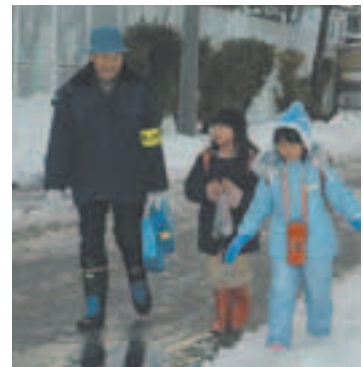
▲船川南小学校では「南っ子見守り隊」を組織して児童の安全を守っています。

子どもたちを犯罪から守るために、市内各地区で防犯パトロールや街頭指導などが行われています。全国的に子ども（特に低学年の児童）を狙った犯罪が続発している中、市内の各小学校では、児童を対象とした防犯教室の開催や学区内の危険箇所をまとめた地域安全マップの作成、登下校時に巡回などを強化して子どもが巻き込まれる犯罪を未然に防ぐために全力をあげて取り組んでいます。また、学校とPTAと地域が連携して自主防犯活動団体を組織し、街頭での声掛けや防犯パトロールなどを行って、地域ぐるみで安全確保に努めています。子どもを狙った犯罪や、子どもの安全を脅かす事件は、いっどこで起こるか分かりません。私たちの身近でも十分に起こりうるという危機感を持ちながら、地域社会全体で次世代を担う子どもたちを守るために、防犯活動を進めていかなければなりません。