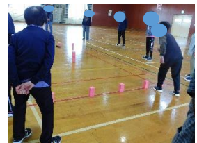
▲室内クップの様子

本事業は脇本体協との共催で毎月最終水曜日に行っています。地域の皆さんの健康づくりに是非ご活用ください。