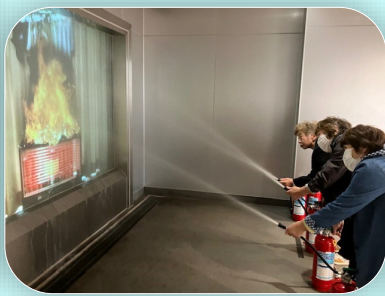
秋田県防災学習館