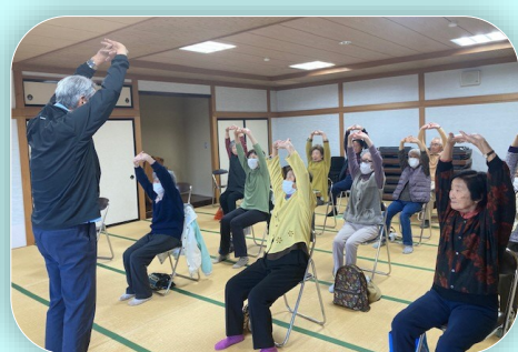
間違えても大丈夫！！脳が活性され認知予防に繋がります