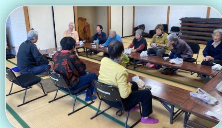
運動の後は「あづば一れ」お茶会