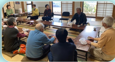
昼食はうどんやそばを美味しくいただきました。