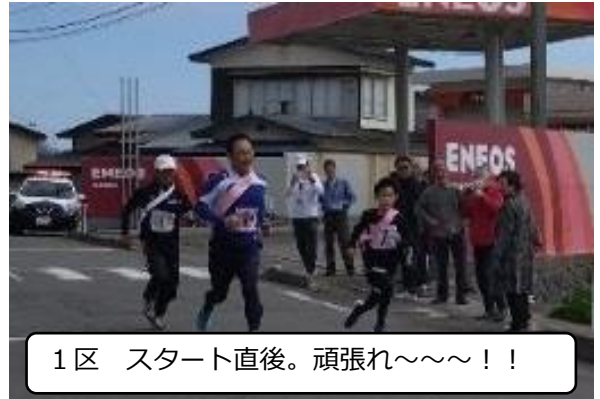
1区 スタート直後。頑張れ～～～!!

優勝 鮪川チーム タイム：39分57秒 準優勝 石神チーム タイム：44分48秒 第3位 箱井チーム タイム：46分47秒