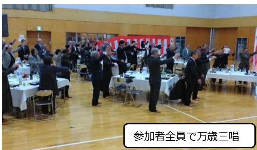
参加者全員で万歳三唱