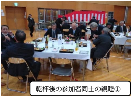
乾杯後の参加者同士の親睦①