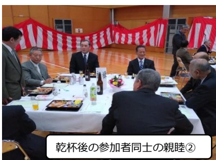
乾杯後の参加者同士の親睦②