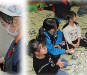
“かるたあそび” お膝の上で いいなあ ↓