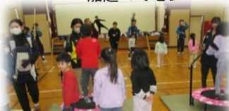
トランポリンも楽しいネ♪