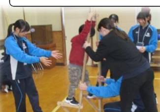
みんなで支えるから大丈夫よ！