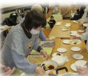
“おかわり”に長蛇の列で民生 委員さんも大忙しです