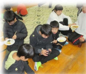
う～ん、お餅おいしいね