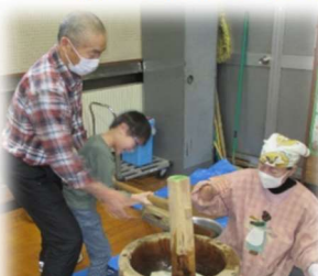
よいしょー、よいしょー 頑張って！