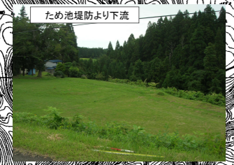
ため池堤防より下流