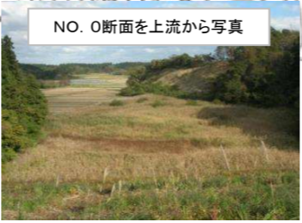
NO. 0断面を上流から写真