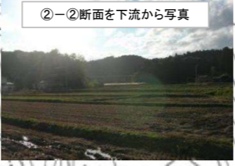
②-②断面を下流から写真