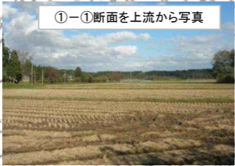
①-①断面を上流から写真