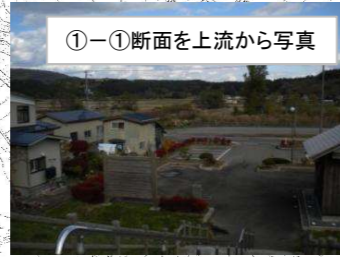
①-①断面を上流から写真