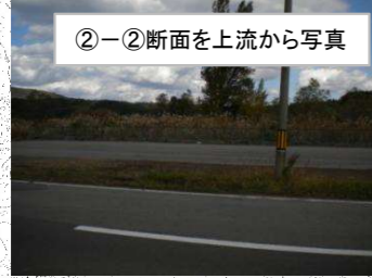
②-②断面を上流から写真