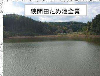
狭間田ため池全景