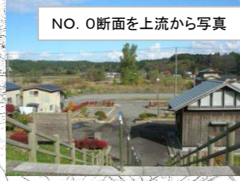
NO. 0断面を上流から写真