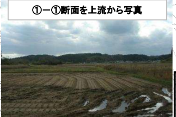
①-①断面を上流から写真