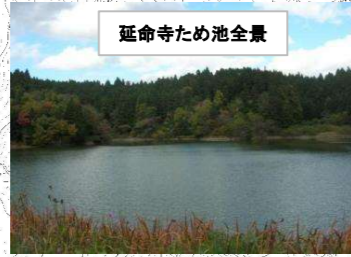
延命寺ため池全景