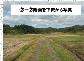
②-②断面を下流から写真